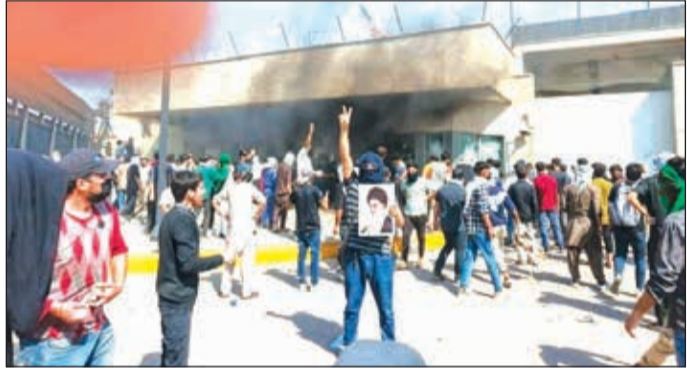
कराचीत अमेरिकेच्या दुतावासावर हल्ला