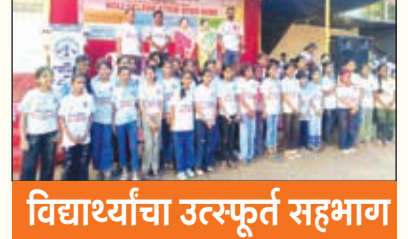
विद्यार्थ्यांचा उत्सुर्त सहभाग

अंधेरी पूर्व येथील श्री नागरदास धारसी भूता हायस्कूलमध्ये पूर्व-प्राथमिक, प्राथमिक आणि माध्यमिक विभागातील विद्यार्थ्यांसाठी होळी उत्सव मोठ्या उत्साहात साजरा करण्यात आला. स्वर्गीय श्री जयसुखलाल नागरदास भूता स्पोर्ट्स कॉम्प्लेक्स येथे झालेल्या या कार्यक्रमाची सुरुवात प्रमुख पाहुण्यांच्या स्वागताने व दीपप्रज्वलनाने झाली. सरस्वती मातेस प्रार्थना अर्पण करून कार्यक्रमाची सुरुवात करण्यात