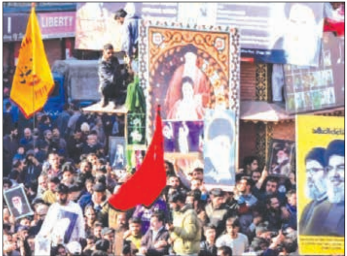
जम्मूमध्ये लोक रस्त्यावर उतरले.

इस्त्रायल-अमेरिका- इराण युद्धाच्या दुसऱ्या दिवशीही दोन्ही बाजूंकडून एकमेकांवर हल्ल्यांचे