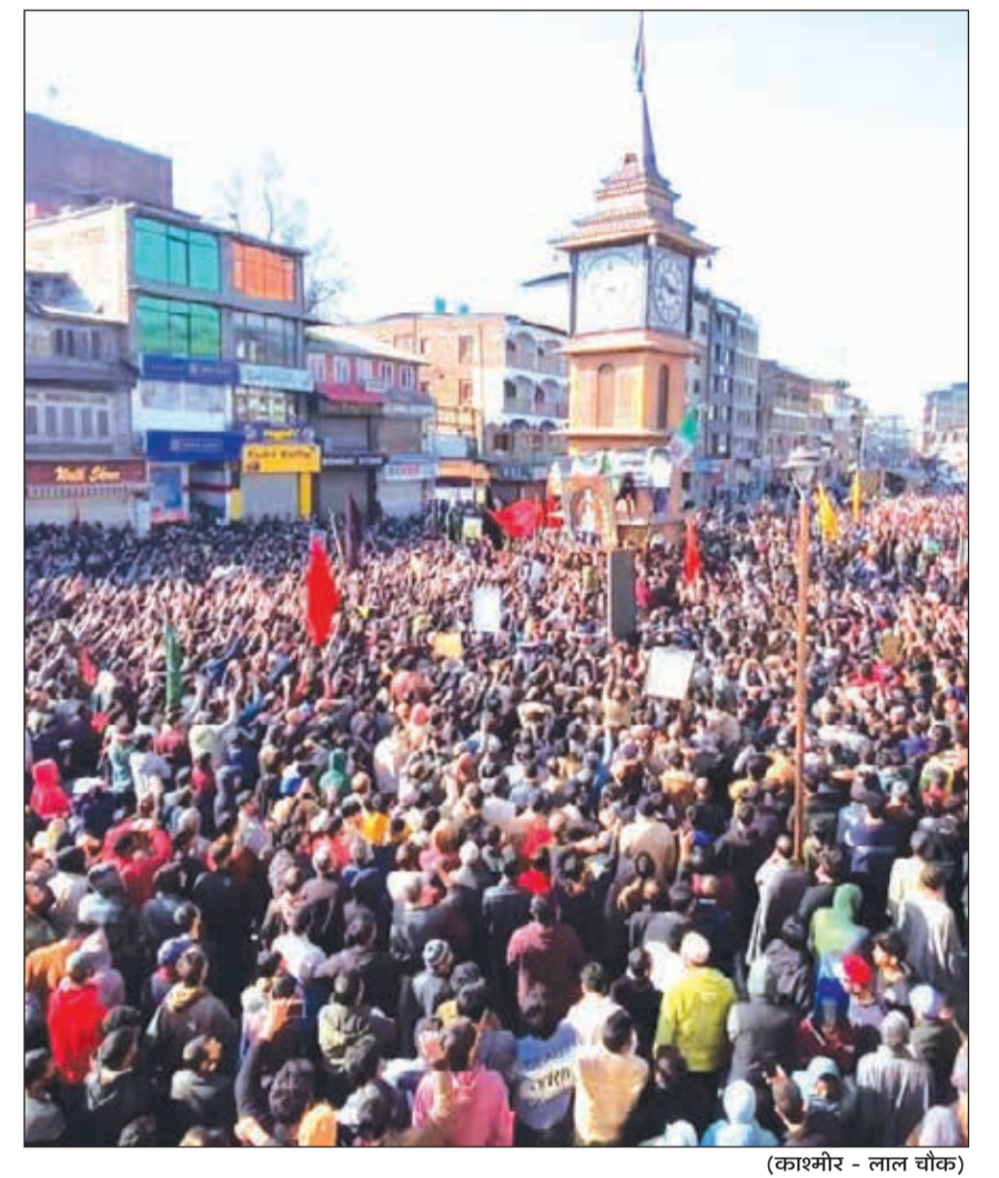
(काश्मीर - लाल चौक)

इराणचे शिया धर्मातील अत्युच्च नेते आयतुल्ला खामेनी हे अमेरिका, इस्त्रायलच्या हल्ल्यात ठार झाल्याचे वृत्त पसरताच जगभरातील शिया मुस्लीम चवताळून रस्त्यावर उतरले. इराणच्या तेहरान शहरातील जमकरन मशिदीवर लाल झेंडा फडकावत त्यांनी बदला घेण्याचा इशारा दिला. अमेरिका आणि इस्त्रायल मुर्दाबादच्या घोषणा देत लाखो शिया मुस्लीम आज रस्त्यावर उतरले. पाकिस्तानच्या कराची आणि लाहोर शहरात संतप्त आंदोलकांनी अमेरिकी दूतावास आणि संयुक्त राष्ट्रांच्या कार्यालयावर चाल करीत प्रचंड तोडफोड केली. त्यांना थांबवण्यासाठी अमेरिकन सुरक्षा रक्षकांनी केलेल्या गोळीबारात कराचीत १२ आंदोलक ठार झाले. शिया मुस्लिमांच्या या संतापाचे हिंसक परिणाम आगामी काळात दिसतील हे निश्चित आहे.