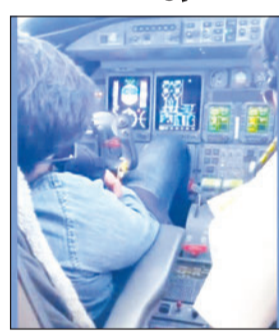
आहेत. या व्हिडिओची नागरी उड्डाण मंत्री मुरलीधर मोहोळ यांनी देखल घेतली आहे. मोहोळ यांनी सांगितले