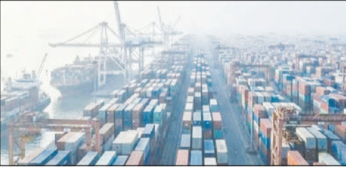
त्यामुळे जेएनपीटी बंदरात कंटेनरच्या लांबच लांब रांगा लागल्या असून, निर्यात प्रक्रिया पूर्णपणे ठप्प झाली

आहे. साधारणपणे १३ टन क्षमतेचा एक कंटेनर दुबई किंवा इतर मध्य-पूर्व देशांकडे पाठवण्यासाठी सुमारे १८ ते २० लाख रुपये खर्च येतो. यात मालाची किंमत, मजुरी, शिपिंग शुल्क, कंटेनर भाडे, स्थानिक वाहतूक आणि कोल्ड स्टोरेजचा खर्च यांचा समावेश असतो. मात्र सध्याच्या तणावपूर्ण परिस्थितीमुळे हे कंटेनर बंदरावरच थांबले असून निर्यात प्रक्रियेत मोठा अडथळा निर्माण झाला आहे.