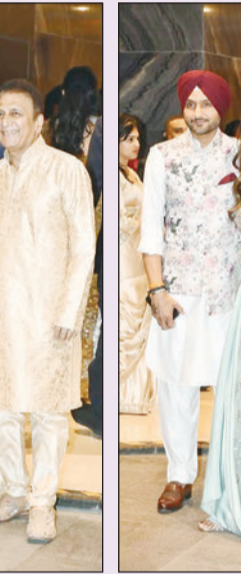
स्टार कपल हरभजन सिंग आणि गीता बसरा