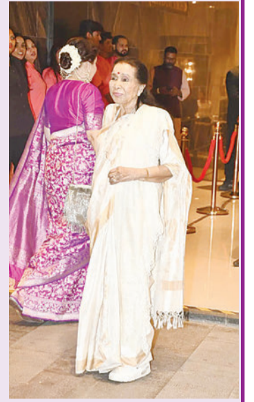
ज्येष्ठ गायिका आशा भोसले यांनीही या जोडप्याला आशीर्वाद दिले