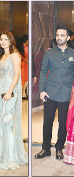
अजिंक्य रहाणे त्याची पत्नी राधिका धोपाकरसोबत