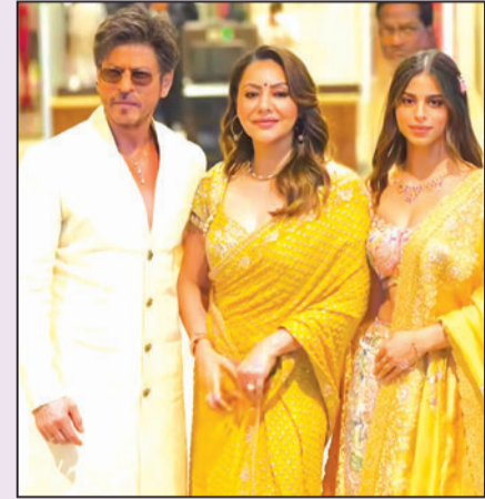
अभिनेता शाहरुख, पत्नी गौरी आणि मुलगी सुहाना सोबत उपस्थित होता.