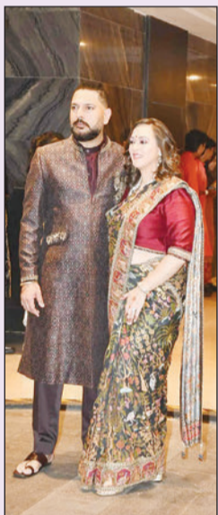
युवराज सिंग आणि हेमल कीच