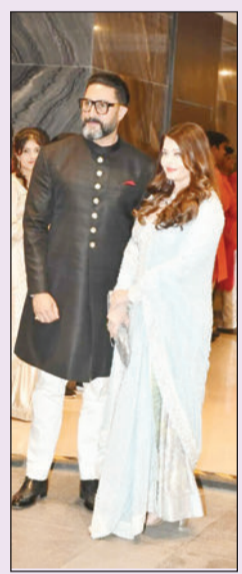
अभिषेक बघन आणि पत्नी ऐश्वर्या राय बघन