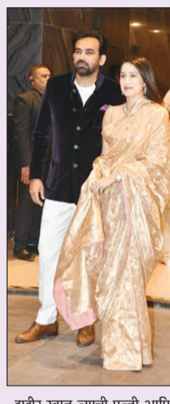
झहीर खान त्याची पत्नी आणि माजी अभिनेत्री सागरिका घाटगेसोबत दिसला.