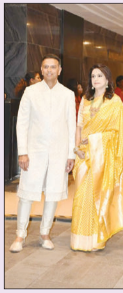
क्रिकेटपटू राहुल द्रविड आणि पत्नी विजेता पेंडारकर