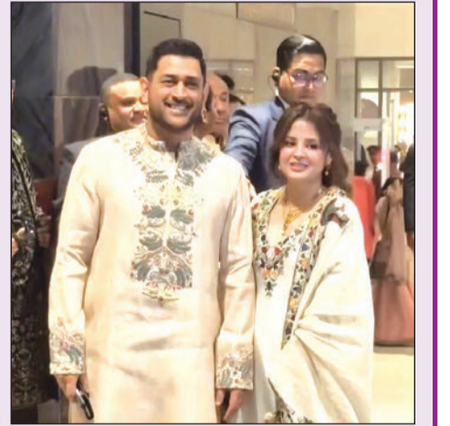
क्रिकेटपटू महेंद्र सिंग धोनी आणि साक्षी यांनी हजेरी लावली