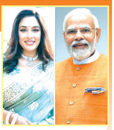
इंडोनेशियाप्रमाणे हत्तींच्या सफारीवर बंदी घालण्याची विनंती केली आहे.

जागतिक वन्यजीव दिनानिमित्त पंतप्रधानांनी दिलेल्या वन्यजीव संरक्षणाच्या संदेशाचा हवाला देत रुपाली गांगुली यांनी भारतातही