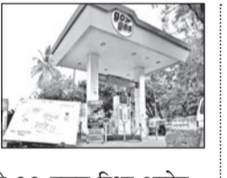
कोल्हापुरात सुमारे २२ हजार रिक्षा आहेत. कर्नाटकमध्ये ८५ रुपये किलो मिळणारा गॅस कोल्हापुरात १०५ रुपयांस विक्री होत असल्याची माहिती रिक्षा संघटनेच्या नेत्यांना मिळाली. त्यामुळे सोमवारी ते पंप चालकांना जाब विचारण्यासाठी गेले. परंतु गॅस नसल्याने पंप बंद होता. त्यामुळे रिक्षा चालकांनी निदर्शने केली. अनेक रिक्षा चालक शाळेतील मुलांना सोडण्याचे काम करतात. आजपासून परीक्षा सुरू झाल्या आहेत. गॅस नसल्याने बहुतांशी रिक्षा चालकांनी विद्यार्थ्यांना शाळेत सोडू शकत नसल्याचे पालकांना सांगितले. त्यामुळे परीक्षा संपेपर्यंत पालकांनाच आता मुलांना शाळेत सोडावे लागणार आहे.

कोल्हापूर सध्या गॅस टंचाईमुळे कोल्हापूर शहरातील रिक्षा व्यवसाय अडचणीत आला आहे. सीएनजीचे दर वाढले आहेत. शिवाय अनेक गॅस पंप बंद आहेत. परिणामी शहरातील एक हजारहून अधिक रिक्षा बंद आहेत. रुईकर कॉलनी चौक, कदमवाडी रोड, कळंबा तपोवन मैदान परिसर आणि सरनोबतवाडी अशा तीन ठिकाणी रिक्षासाठी पंप आहेत. दोन दिवसांपासून कदमवाडी रोड आणि तपोवन येथील पंप बंद आहेत. सरनोबतवाडी येथे काल ७०० हून अधिक रिक्षा रांगेत होत्या.