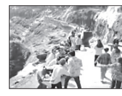
मार्त, गेल्या दोन महिन्यांत मधमाश्यांच्या हल्ल्याची ही पहिली घटना असल्याने विशेषतः महिला आणि लहान मुलांमध्ये भीतीचे वातावरण निर्माण झाले आहे. पर्यटकांच्या सुरक्षेसाठी

अनेकांना चावा बसल्याने परिसरात एकच गोंधळ उडाला. दररोज हजारो पर्यटक अजिंठा लेणी पाहण्यासाठी येतात. मधमाश्यांनी दोन वेळा हल्ला केल्याने देश-विदेशातून आलेले ११ पर्यटक जखमी झाले. सकाळच्या सुमारास लेणी क्रमांक १० जवळील मोहोळातून मधमाशा अचानक बाहेर पडल्या आणि त्यांनी पर्यटकांवर हल्ला केला. यामध्ये काही पर्यटक जखमी झाले. या घटनेनंतर अवघ्या तासाभरात लेणी क्रमांक २६ जवळ पुन्हा मधमाश्यांनी हल्ला केला. दुसऱ्या हल्ल्यातही