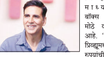
केली होती. याच धर्तीवर 'भूत बंगला' देखील प्रदर्शनापूर्वीच प्रेक्षकांना आकर्षित करण्याचा प्रयत्न करण्याची शक्यता आहे.

ज्येष्ठ अभिनेत्री शबाना आझमी यांची प्रमुख भूमिका असलेली ब्रिटिश दूरचित्रवाणी मालिका 'नेव्स्ट ऑफ किंग' आता भारतीय प्रेक्षकांसाठी ओटीटी प्लॅटफॉर्मवर प्रदर्शित होत आहे. या कौटुंबिक थ्रिलरमध्ये शबाना आझमी यांनी साकारलेली मिसेस शिराणी ही व्यक्तिरेखा आशियाई मातांच्या रूढ चोकटी मोडणारी असल्याचे त्यांनी म्हटले आहे. 'लायन्सगेट प्ले'वर प्रदर्शित होणाऱ्या या मालिकेच्या पार्श्वभूमीवर शबाना आझमी आणि अर्ची पंजाबी यांनी आपल्या भूमिकाविषयी सविस्तर चर्चा केली.