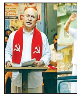
या व्हिडिओमध्ये हे तिन्ही नेते केरळच्या पारंपरिक वेशभूषेत दिसतात. ट्रम्प पांढरा शर्ट आणि भगवा स्कार्फ घालून भाषण करताना, पुतिन लाल धातूच्या वेश्यासह प्रचार करताना, तर किम जोंग उन घराघरांत जाऊन मतदारांशी संवाद साधताना दाखवले आहेत.

वेगवेगळ्या पक्षांचे प्रतिनिधी म्हणून प्रचार करताना दिसतात. ट्रम्प पांढरा शर्ट आणि भगवा स्कार्फ घालून भाषण करताना, पुतिन लाल धातूच्या वेश्यासह प्रचार करताना, तर किम जोंग उन घराघरांत जाऊन मतदारांशी संवाद साधताना दाखवले आहेत. या व्हिडिओमध्ये हे तिन्ही नेते केरळच्या पारंपरिक वेशभूषेत दिसतात. ट्रम्प पांढरा शर्ट आणि भगवा स्कार्फ घालून भाषण करताना, पुतिन लाल धातूच्या वेश्यासह प्रचार करताना, तर किम जोंग उन घराघरांत जाऊन मतदारांशी संवाद साधताना दाखवले आहेत.