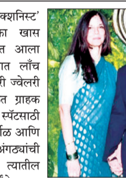
आमिरने 'क्वीन'मध्ये धोरणात्मक गुंतवणूकदार म्हणूनही सहभाग घेतला आहे. कलाकारांनी एखाद्या ब्रँडमध्ये गुंतवणूक करणे ही सामान्य बाब असली, तरी स्वतःच्या गुंतवणुकीतून अशा प्रकारे वैयक्तिक खरेदी करून ब्रँडवर विश्वास दर्शवणे दुर्मीळ मानले जाते.