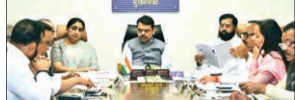
महावितरणच्या वितरण व्यवस्थेत अधिक पारदर्शकता आणि कार्यक्षमता वाढवण्याचा उद्देश असल्याचे सांगण्यात येत आहे. याशिवाय, महावितरण कंपनीला भांडवली सादर करण्यात आला होता. या निर्णयामुळे महावितरणच्या आर्थिक स्थितीत सुधारणा होण्याची अपेक्षा व्यक्त केली जात आहे.

मुंबई तसेच महावितरणच्या कृषी बाजारात सूचीबद्ध (लिस्टेड) वितरण व्यवसायाचे विभाजन करण्याचा निर्णय घेण्यात आला आहे. या बदलामुळे विभागामार्फत हा प्रस्ताव करण्याची महत्त्वाचा निर्णय घेण्यात आला आहे. ऊर्जा विभागामार्फत हा प्रस्ताव आर्थिक पुनर्रचनेला मंजूरी देण्यात आली. या निर्णयानुसार, शासन हमी असलेल्या सुमारे ३२,६७९ कोटी रुपयांच्या कर्जासाठी भांडवली बाजारात सरकारी रोखे (बॉण्ड्स) जारी करण्यात येणार आहेत. यामुळे कंपनीवरील आर्थिक ताण कमी करण्याचा प्रयत्न केला जाणार आहे.