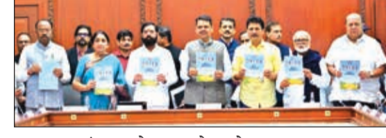
कल्याणच्या संकल्प केला आहे. लोकसहभागाने ही मोहीम व्यापक आरोग्य चळवळ म्हणून उभी राहावी, हा शासनाचा मानस असून, गावपातळीपासून राज्यस्तरीय आरोग्य सेवांचे सक्षमीकरण करण्यावर भर देण्यात येणार आहे. उपचारापेक्षा प्रतिबंधात्मक उपाययोजनांवर अधिक भर देणे. स्वच्छता, शुद्ध पाणीपुरवठा, सांडपाणी व्यवस्थापन, पोषण, तसेच संसर्गजन्य व असंसर्गजन्य आजारंवर नियंत्रण यांसारख्या मूलभूत घटकांवर लक्ष केंद्रित करून ग्रामीण नागरिकांच्या आरोग्यदायी जीवनशैलीला प्रोत्साहन दिले जाणार आहे. माता-बाल आरोग्य, मानसिक आरोग्य आणि बदलत्या जीवनशैलीशी निगडित आजारांसाठी मोहिमेत विशेष स्थान देण्यात आले आहे. या अभियानाच्या प्रभावी अंमलबजावणीसाठी राज्य, विभाग, जिल्हा आणि ग्रामपंचायत स्तरावर समन्वयित स्थानाच्या करण्यात आली असून, निकसंग्रसार उत्कृष्ट कामगिरी करणाऱ्या गावांना 'आरोग्यसंपन्न गाव' म्हणून गौरविण्यात येणार आहे. यासाठी राज्य शासनाने ग्रामपंचायत, जिल्हा परिषद, पंचायत समिती, आरोग्य संस्थांना ६५.२५ कोटी रुपयांचे पुरस्कार देणार आहेत.

प्रकाशनही मान्यवरांच्या हस्ते करण्यात आले. राज्य शासनाने 'माझं गाव, आरोग्यसंपन्न गाव' या अभियानाच्या माध्यमातून ग्रामीण महाराष्ट्रातील आरोग्य व्यवस्था अधिक सक्षम, रोगमुक्त आणि स्वयंपूर्ण करण्याचा संकल्प केला आहे. लोकसहभागाने ही मोहीम व्यापक आरोग्य चळवळ म्हणून उभी राहावी, हा शासनाचा मानस असून, गावपातळीपासून राज्यस्तरीय आरोग्य सेवांचे सक्षमीकरण करण्यावर भर देण्यात येणार आहे. उपचारापेक्षा प्रतिबंधात्मक उपाययोजनांवर अधिक भर देणे. स्वच्छता, शुद्ध पाणीपुरवठा, सांडपाणी व्यवस्थापन, पोषण, तसेच संसर्गजन्य व असंसर्गजन्य आजारंवर नियंत्रण यांसारख्या मूलभूत घटकांवर लक्ष केंद्रित करून ग्रामीण नागरिकांच्या आरोग्यदायी जीवनशैलीला प्रोत्साहन दिले जाणार आहे. माता-बाल आरोग्य, मानसिक आरोग्य आणि बदलत्या जीवनशैलीशी निगडित आजारांसाठी मोहिमेत विशेष स्थान देण्यात आले आहे. या अभियानाच्या प्रभावी अंमलबजावणीसाठी राज्य, विभाग, जिल्हा आणि ग्रामपंचायत स्तरावर समन्वयित स्थानाच्या करण्यात आली असून, निकसंग्रसार उत्कृष्ट कामगिरी करणाऱ्या गावांना 'आरोग्यसंपन्न गाव' म्हणून गौरविण्यात येणार आहे. यासाठी राज्य शासनाने ग्रामपंचायत, जिल्हा परिषद, पंचायत समिती, आरोग्य संस्थांना ६५.२५ कोटी रुपयांचे पुरस्कार देणार आहेत.