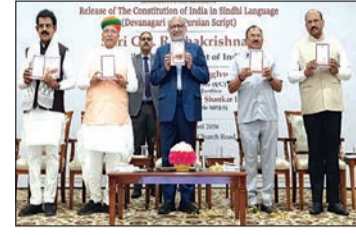
आवृत्तीचे प्रकाशन उपराष्ट्रपती सी.पी. राधाकृष्णन यांच्या हस्ते करण्यात आले. याप्रसंगी बोलताना राधाकृष्णन म्हणाले की, सिंधी ही सर्वात जुन्या आणि मधुर भाषांपैकी एक आहे. भारताच्या स्वातंत्र्यानंतर प्रथमच देवनागरी लिपीतील भारतीय संविधानाच्या सिंधी आवृत्तीचे प्रकाशन करण्यात आले

भारताचे उपराष्ट्रपती सी. पी. राधाकृष्णन यांनी नवी दिल्लीत सिंधी भाषेतील संविधानाची नवीन आवृत्ती प्रकाशित केली. ही आवृत्ती देवनागरी आणि फारसी या दोन्ही लिपीमध्ये उपलब्ध आहे. सिंधी समुदाय आणि भाषिक विविधता जपण्याच्या उद्देशाने हे प्रकाशन करण्यात आले असून, हे संविधानाचे सिंधी भाषेतील अधिकृत रूप आहे. दिल्लीतील उपराष्ट्रपती भवनात सिंधी भाषा दिनाचे औचित्य साधून संविधानाच्या सिंधी भाषांतरित आवृत्तीचे प्रकाशन करण्यात आले