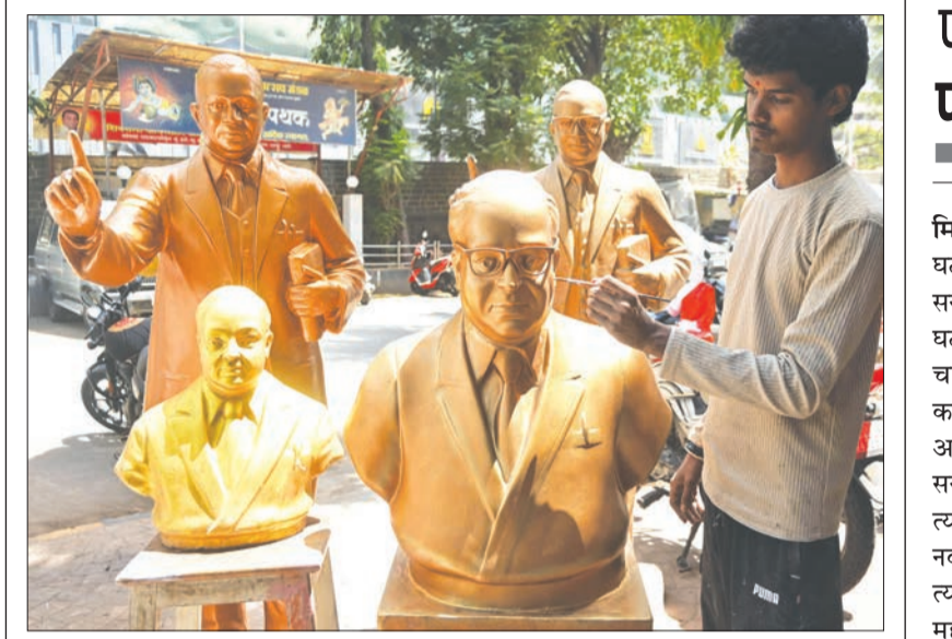
१४ एप्रिल रोजी होणाऱ्या डॉ. बाबासाहेब आंबेडकर जयंतीपूर्वी एक कलाकार डॉ. बाबासाहेब आंबेडकर यांची मूर्ती तयार करत आहे.

बोरीवली पश्चिम येथील नाला साफसफाईच्या कामात कथित गैरप्रकार उघडकीस आल्याचा दावा स्थानिक नागरिकांनी केला आहे. रात्री नाल्यात दगड व माती टाकून दिवसा त्यालाच गाळ म्हणून काढल्याचे दाखवले जात असल्याचा आरोप करण्यात येत आहे. त्यामुळे साफसफाईच्या नावाखाली महापालिकेची फसवणूक होत असल्याचेही नागरिकांचे म्हणणे आहे. या संदर्भात आर/मध्य विभागाच्या सहाय्यक आयुक्तांकडे तक्रार दाखल करण्यात आली आहे. या प्रकरणी दोष सिद्ध झाल्यास संबंधित कंत्राटदाराला काळ्या यादीत टाकण्यात येईल, असे आश्वासन अतिरिक्त आयुक्तांनी दिले आहे.