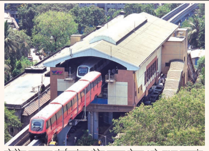
मोनोरेल लवकरच मुंबईकरांच्या सेवेत दारवळ होणार आहे. सध्या नायगांव मोनो स्टेशन येथे तिची ट्रायल रन सुरु आहे.

प्रशासनाला न दिल्यास ग्रामपंचायत सदस्यांविरुद्ध अपात्रतेचा प्रस्तावही सादर केला जाणार आहे. मागील महिन्यात जिल्ह्यात विनापरवाना उभारण्यात आलेल्या पुतळ्यांच्या घटनांच्या पार्श्वभूमीवर प्रशासनाने ही कडक भूमिका घेतली आहे. कोणत्याही महापुरुषाचा पुतळा उभारण्यासाठी प्रशासनाने ९ अटी व नियम निश्चित केले आहेत. यामध्ये जागेच्या मालकीचे पुरावे, ग्रामपंचायत किंवा नगरपंचायतीचा ठराव, पोलिसांचा अहवाल, कला संचलनालयाचा अहवाल, सार्वजनिक बांधकाम विभागाचे ना हरकत प्रमाणपत्र आदी कागदपत्रांचा समावेश आहे.