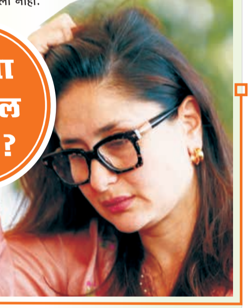
करीना का ट्रोल होतेय?

असतात, हे सर्वांसाठी अन्यायकारक आहे. दुसऱ्या एका युजरने या घटनेला 'व्हीआयपी संस्कृतीचा' नमुना ठरवत म्हटले की, एका साध्या रांगेमुळे सुरक्षित समाज आणि गुलामगिरीच्या मानसिकतेतील फरक दिसून येत. काही नागरिकांनी तर नागरी विमानचालन मंत्रालय आणि गृह मंत्रालयाला टॅग करून विचारले आहे की, कोणत्या कायदांतर्गत या बॉलीवूड कलाकारांना अशा विशेष सवलती दिल्या जातात? या वादाच्या दरम्यान, करीना कपूर खान आपल्या कुटुंबासह वानखेडे स्टेडियमवर मुंबई इंडियन्स आणि रॉयल चॅलेंजर्स बंगळूरु यांच्यातील आयपीएल सामना पाहताना दिसली असून, तिने अद्याप या वादावर कोणतीही अधिकृत प्रतिक्रिया दिलेली नाही.