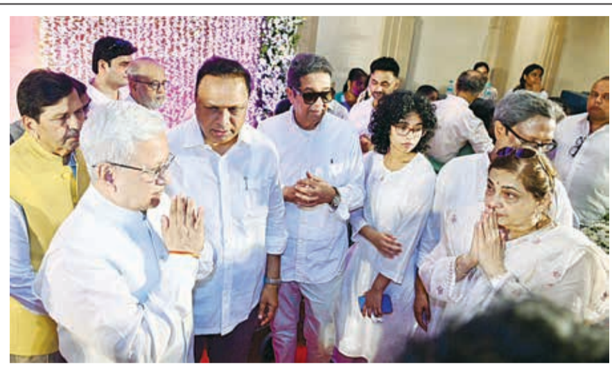
महाराष्ट्राचे राज्यपाल जिष्णु देव वर्मा यांनी आज ज्येष्ठ पार्श्वगायिका आशा भोसले यांच्या पार्थिव्याचे त्यांच्या मुंबई येथील निवासस्थानी जाऊन दर्शन घेतले तसेच त्यांच्या कुटुंबियांचे सांत्वन केले.

अत्यल्प असल्याने केवळ ग्रामीण भागातील अंत्योदय (गरजू) शिधापत्रिकाधारकांनाच रॉकेलचा लाभ दिला जाणार आहे. नगरपालिका क्षेत्रातील नागरिकांना या वितरणातून वगळण्यात आले आहे. तालुकानिहाय वाटपात बारामतीला सर्वाधिक ३३ हजार लीटर, तर इंदापूरला २७ हजार लीटर रॉकेलचा पुरवठा केला जाणार आहे. उर्वरित तालुक्यांनाही शिधापत्रिकांची संख्या लक्षात घेऊन कोटा देण्यात आला आहे.