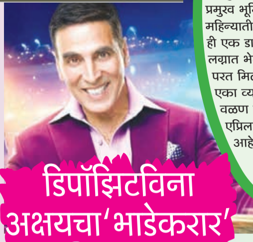
डिपॉझिटविना अक्षयचा 'भाडेकरार'

या व्यवहारातील सर्वात महत्त्वाची गोष्ट म्हणजे, मुंबईतील भाडे बाजारत सुरक्षेसाठी 'डिपॉझिट' घेण्याची पद्धत असताना, अक्षयने या करारासाठी कोणतेही सिव्क्युरिटी डिपॉझिट घेतलेले नाही. तसेच भाड्यात वाढ करण्याची कोणतीही अट (एस्केलेशन क्लॉज) या करारामध्ये नमूद केलेली नाही. नोंदणी कागदपत्रांमध्ये अक्षय कुमारचे पूर्ण नाव 'अक्षय