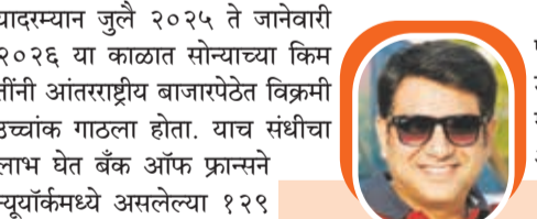
सौग सागर शहा

यापूर्वी पोलंडने २०१९ मध्येच बँक ऑफ इंग्लंडमधून १०० टन सोने परत आणले होते. जर्मनीच्या बुडेसबॅकने २०१७ पर्यंत न्यूयॉर्क आणि पॅरिसमधून ६७४ टन सोने फ्रँकफर्टला हलवून एक मोठा टप्पा गाठला होता. अलीकडेच नायजेरियासारख्या आफ्रिकन देशांनीही अमेरिकन अर्थव्यवस्थेबद्दलच्या चिंतेमुळे आपले सुवर्ण साठे परत नेण्यास सुरुवात केली आहे. भारतीय रिझर्व्ह बँकेनेही २०२४ मध्ये बँक ऑफ इंग्लंडमधून १०० मेट्रीक टन सोने मायदेशी आणले होते. यामागे एक प्रमुख कारण म्हणजे अमेरिकेकडून घातले जाणारे निर्बंध आणि