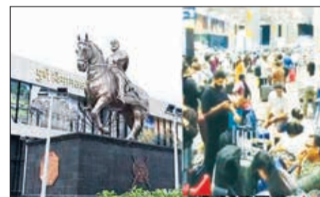
मिळाली नाही. आम्हाला बसायलाही जागा नाही. काही प्रवाशांनी एरो मॉल येथे रात्र काढल्याचे सांगितले. विमानतळ प्रशासनाकडून केवळ फ्लायट रद्द झाल्याची माहिती देण्यात येत आहे.

पुणे आंतरराष्ट्रीय विमानतळ येथे भारतीय वायुसेनेच्या विमानाने केलेल्या हार्ड लँडिंगनंतर धावपट्टी (रन्वे) तात्पुरती बंद करण्यात आल्याने विमान वाहतूक तब्बल ८ तास ठप्प झाली. या घटनेमुळे शेकडो प्रवाशांना रात्रभर विमानतळावरच ताटकळत बसावे लागले. या घटनेमुळे अनेक उड्डाणे रद्द करण्यात आली. त्यामध्ये इंडिगोची ६५, एअर इंडियाची ६, स्पाइसजेटची ५, आकासा एअरची ५ आणि एअर इंडिया एक्सप्रेसच्या १० उड्डाणांचा समावेश होता. त्यामुळे विमानतळावर मोठ्या प्रमाणात प्रवाशांची गर्दी उसळली होती. अनेक प्रवासी रात्रीपासून विमानतळावर अडकून पडले होते. काहीना बसण्यासाठी जागाही मिळत नव्हती, तर पाणी आणि इतर मूलभूत सुविधांचा अभाव जाणवत होता. वांटेडहून आलेल्या काही प्रवाशांनी सांगितले की, आम्ही रात्री १० वाजल्यापासून विमानतळावर आहोत. आमचे विमान रद्द झाले, पण विमानतळ प्रशासनाकडून कोणतीही टोस माहिती किंवा मदत