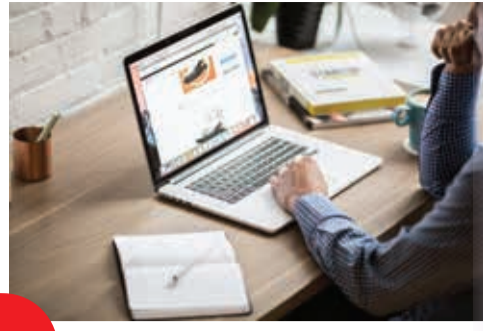
प्रकाश असलेल्या खोलीत काम केल्याने नकारात्मक ऊर्जा आणि आळशीपणा वाढतो.

वाढीसाठी उच्च पाठ असलेली खुर्ची निवडा. हे तुम्हाला तुमच्या करिअरमध्ये चांगले समर्थन आणि स्थिरता प्रदान करते. गडद किंवा अंधुक प्रकाश असलेल्या खोलीत काम केल्याने नकारात्मक ऊर्जा आणि