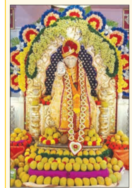
भायस्वळा येथील श्री साईबाबा मंदिरात अक्षय तृतीयेला आंब्यांची आरास करण्यात आली.