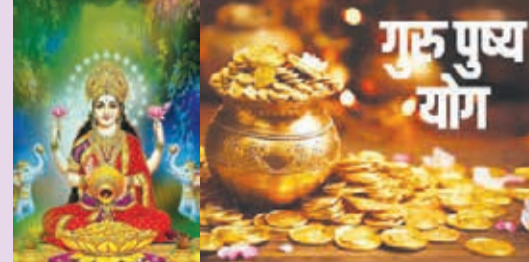
गुरु पुष्य योग

पहाटे स्नान करून लक्ष्मी-विष्णूची पूजा करावी, पिवळे वस्त्र परिधान करावे आणि लक्ष्मीच्या मंत्राचा जप करावा. लक्ष्मीला हळद, केशर अर्पण करणे शुभ मानले जाते. सोने, चांदी, जमीन, मालमत्ता किंवा नवीन वाहने खरेदी करण्यासाठी हा काळ अत्यंत शुभ आहे. लक्ष्मी माता आणि भगवान विष्णूची पूजा करावी. महालक्ष्मी मंत्राचा १०८ वेळा जप करा. गरजूंना अन्न, वस्त्र किंवा पैशांचे दान करा. या दिवशी केलेली सेवा वाया जात नाही, असे मानले जाते. नवीन व्यवसाय, शिक्षण किंवा गुंतवणुकीची सुरुवात करणे अत्यंत शुभ मानले जाते. गुरुवारी पुष्य नक्षत्र असल्यास घरात हळकुंड, लवंग किंवा पाच गोमती चक्र आणून पूजाघरात ठेवल्याने लक्ष्मी प्रसन्न होते. हा योग गुरु आणि पुष्य नक्षत्र यांच्या संयोगामुळे बनतो आणि आर्थिक वृद्धीसाठी विशेष मानला जातो. गुरुपुष्यामृत योग- २३ एप्रिल २०२६ गुरुवारी रात्री ०८.५७ पासून पहाटे ०६.१७ वाजेपर्यंत गुरुपुष्यामृत योग असणार आहे. गुरुपुष्यामृत योगामध्ये केलेल्या कामामुळे धन, समृद्धी आणि आर्थिक लाभ मिळतात, असे मानले जाते. नवीन व्यवसाय, गुंतवणूक, खरेदी आणि महत्त्वाच्या कामांचा शुभारंभ करण्यासाठी शुभ दिवस मानला जातो. या दिवशी पहाटे उठून स्नान करून स्वच्छ वस्त्र परिधान करा. घरातील देव्हान्यामध्ये तुपाचा दिवा लावावा. लक्ष्मीमातेसह सर्व देवांना फळ, पुष्प, गंध, नैवेद्य अर्पण करून पूजा करावी. लक्ष्मीमातेच्या मंत्राचा १०८ वेळा जप करावा. या दिवशी नकारात्मक वागणे आणि कार्य टाळा. मांस तसेच मद्य सेवन करणं टाळा. वादविवाद करणं टाळावे.