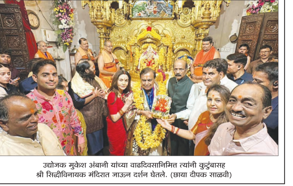
उद्योजक मुकेश अंबानी यांच्या वाढदिवसानिमित्त त्यांनी कुटुंबासह श्री सिद्धीविनायक मंदिरात जाऊन दर्शन घेतले.

रेल्वे प्रशासन, पोलीस आणि आपत्कालीन पथक घटनास्थळी दाखल झाले. लिफ्टमध्ये अडकलेल्या प्रवाशांना बाहेर काढण्यासाठी त्वरित प्रयत्न करून काही वेळातच सर्व प्रवाशांची सुरक्षित सुटका करण्यात यश मिळाले. लिफ्ट कोसळण्यामागील नेमके कारण स्पष्ट झालेले नाही. तांत्रिक बिघाड की, देखभालीतील हलगर्जीपणा याबाबत प्रशासनाने चौकशी सुरू केली.