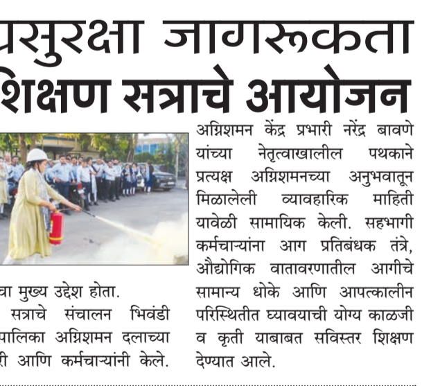
उपक्रमाचा मुख्य उद्देश होता. या सत्राचे संचालन भिवंडी महानगरपालिका अग्निशमन दलाच्या अधिकारी आणि कर्मचाऱ्यांनी केले.

■ भिवंडी टोरेट पॉवर लिमिटेड, भिवंडीतर्फे १४ ते २० एप्रिल या कालावधीत एक व्यापक 'अग्नि सुरक्षा जागरूकता आणि आपत्कालीन प्रतिसाद प्रशिक्षण' कार्यक्रम आयोजित करण्यात आला होता. कर्मचाऱ्यांमधील सज्जता, प्रतिबंधात्मक जागरूकता आणि आपत्कालीन परिस्थितीत प्रतिसाद देण्याची क्षमता वाढवणे हा या