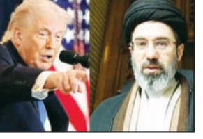
परिस्थितीत उद्या हे दोन देश चर्चेसाठी एकत्र येतील का, याकडे संपूर्ण जगाचे लक्ष लागले आहे. इराण आणि अमेरिका

त्या थराला जाण्यास मागेपुढे पाहणार नाही, असे थेट प्रत्युत्तर इराणच्या रिव्हॉल्युशनरी गार्डने ट्रम्प यांना दिले आहे. अशा यांच्यात समेट घडवून आणण्यासाठी पाकिस्तानचे पंतप्रधान शहबाज शरीफ आग्रही आहेत. उद्या होणाऱ्या चर्चेसाठी त्यांनी दोन्ही देशांच्या प्रतिनिधींशी चर्चा केली. यामुळे दोन्ही पक्षांनी चर्चा करण्यास वरकणी सहमती दर्शवली आहे. परंतु प्रत्यक्षात होर्मुजमध्ये होत असलेल्या घडामोडी जगाची चिंता वाढवणाऱ्या आणि युद्धविरामाची शक्यता धुसर करणाऱ्या आहेत. ट्रम्प अजूनही इराणला धमक्या देत आहेत. तर इराणचे रिव्हॉल्युशनरी गार्ड ट्रम्प यांच्या धमक्यांना पान २ वर