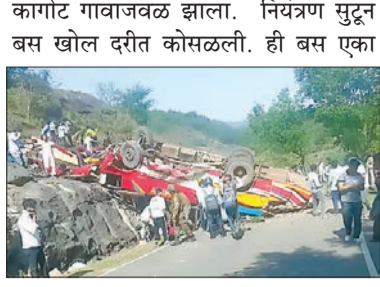
दुर्घटनेत ठार झालेल्या जखमींना रुग्णालयात उपचार देण्यात येत आहेत. या अपघातात २० जणांचा मृत्यू झाला.

उधमपूर जम्मू-श्रीनगर मार्गावर उधमपूर जिल्ह्यात एक प्रवासी बस दरीत कोसळल्याने २० जणांचा मृत्यू झाला. अनेक प्रवासी गंभीर जखमी झाले आहेत. पंतप्रधान नरेंद्र मोदी यांच्यासह अनेक नेत्यांनी दुःख व्यक्त केले आहे. पंतप्रधानांनी मृतांच्या नातेवाईकांना २ लाख रुपये आणि जखमींना ५० हजार रुपयांची आर्थिक मदत जाहीर केली आहे. अधिकाऱ्यांनी सांगितले की, हा अपघात आज सकाळी रामनगर परिसरातील