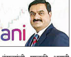
या तिन्ही कंपन्यांची मालकी अदानी एअरपोर्ट सिटी लिमिटेडकडे आहे. या कंपन्यांच्या माध्यमातून अदानी समूह विमानतळ परिसरात मोठ्या प्रमाणावर पायाभूत सुविधा निर्माण करणार आहे.

घेतलेल्या भूखंडांवर बांधकाम प्रकल्प, रेस्टॉरंटस, बँकेटस आणि विमानसेस सेंटर्ससाठी हॉटेल चालवण्याचे काम करतील. या प्रत्येक उपकंपनीची स्थापना दहा लाख रुपयांच्या भरणा केलेल्या भांडवलासह करण्यात आली आहे.