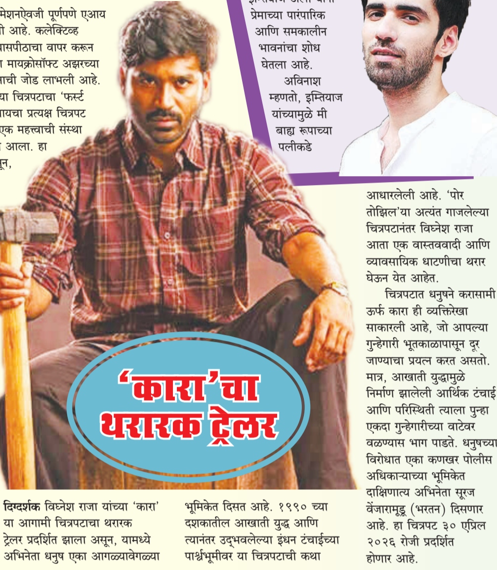
'कारा'चा थरारक ट्रेलर