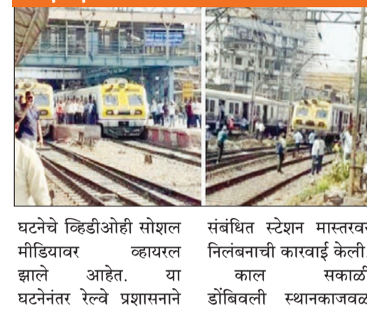
सीएसएमटीत दोन लोकल समोरासमोर

डोंबिवली रेल्वे स्थानकात काल सकाळी रिकाम्या लोकलचा एक डबा रुळावरून घसरल्याने मध्य रेल्वेची वाहतूक विस्कळीत झाली होती. ही घटना ताजी असतानाच, आज पुन्हा दिवसभरात दोन वेळा मध्य रेल्वेची सेवा खोळंबल्याने प्रवाशांना मोठा त्रास सहन करावा लागला. स्थानकावर प्रचंड गर्दी उसळली होती.