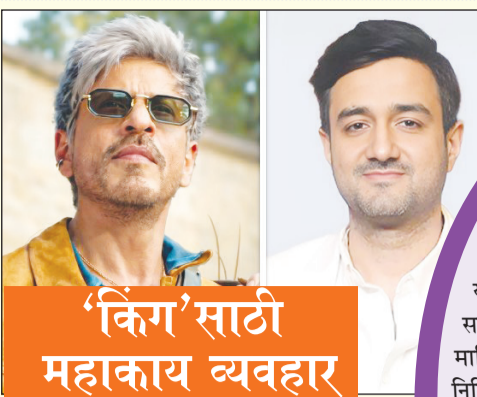
'किंग'साठी महाकाय व्यवहार

चित्रपटाची निर्मिती पारंपारिक व्हीएफएक्स किंवा अनिमेशनऐवजी पूर्णपणे एआय आधारित तंत्रज्ञानावर करण्यात आली आहे. कलेक्टिव्ह आर्टिस्ट नेटवर्कच्या गॅलरी ५ या व्यासपीठाचा वापर करून ही निर्मिती केली गेली आहे, ज्याला मायक्रोसॉफ्ट अडॉरच्या प्रगत एआय आणि क्लाऊड तंत्रज्ञानाची जोड लाभली आहे. मायक्रोसॉफ्टच्या मुख्य कार्यक्रमात या चित्रपटाचा 'फर्स्ट लुक' दाखवण्यात आला, जिथे एआयचा प्रत्यक्ष चित्रपट निर्मितीमध्ये प्रभावी वापर करणारी एक महत्त्वाची संस्था म्हणून कलेक्टिव्हचा गौरव करण्यात आला. हा चित्रपट हिस्ट्रीव्हर्सचा एक भाग असून, या अंतर्गत काली, कर्ण आणि गुर्ण यांसारख्या भारतीय पौराणिक आणि ऐतिहासिक पात्रांवर आधारित महत्त्वाकांक्षी चित्रपट मालिका तयार केली जाणार आहे.