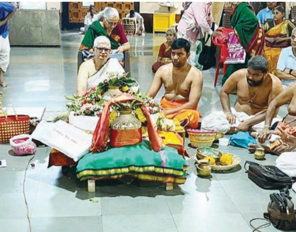
आदि शंकराचार्य यांची १२३८ वी जयंती मुंबईतील माटुंगा येथील श्री शंकर मठात मोठ्या उत्साहात साजरी केली. देशातील एकमेव मंदिर म्हणून ओळखल्या जाणाऱ्या या मठात आदि शंकराचार्यांची मुख्य मूर्ती असल्याचे मानले जाते. माटुंगा मठात ११ दिवसांचा विशेष उत्सव सुरू असून, यात होम, सुवातिकी पूजा, पादपूजा, गायत्री होम, रुद्राभिषेक, हळदी-कुंकू आणि अन्नदान यांसारखे धार्मिक कार्यक्रम आयोजित करण्यात आले आहेत.