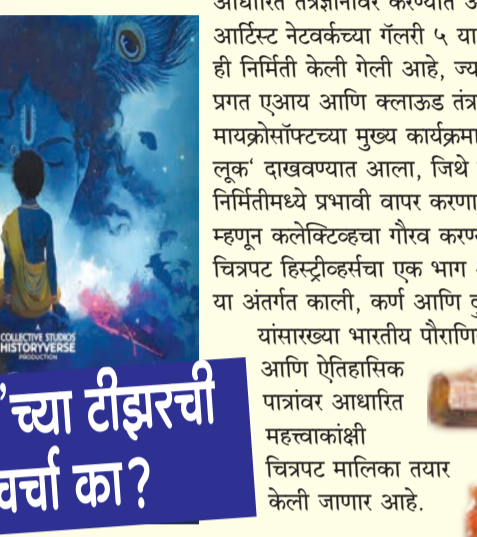
'कृष्ण'च्या टीझरची चर्चा का?