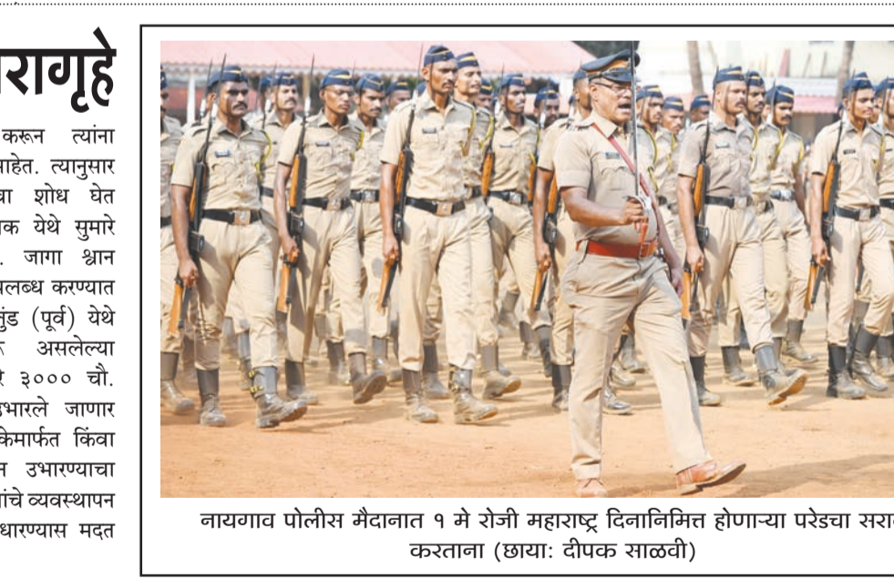
नायगाव पोलीस मैदानात १ मे रोजी महाराष्ट्र दिनानिमित्त होणाऱ्या परेडचा सराव करताना

भटक्या श्वानांची नसबंदी करून त्यांना निवारणगृहात ठेवण्याचे आदेश आहेत. त्यानुसार महानगरपालिकेने योग्य जागांचा शोध घेत हा निर्णय घेतला आहे. आणिक येथे सुमारे ८४११ चौ. मी. जागा श्वान निवारणगृहासाठी उपलब्ध करण्यात आली असून, मुलुंड (पूर्व) येथे आधीपासून सुरु असलेल्या निर्बिजीकरण केंद्रासोबतच सुमारे ३००० चौ. मी. क्षेत्रावर नवे निवारणगृहे उभारले जाणार आहे. हा प्रकल्प महानगरपालिकेमार्फत किंवा सार्वजनिक-खाजगी भागीदारीतून उभारण्याचा विचार असून, यामुळे भटक्या श्वानांचे व्यवस्थापन आणिक येथील रुग्णालयाच्या ७ नोव्हेंबर २०२५ च्या निर्देशानुसार सार्वजनिक ठिकाणांजवळील