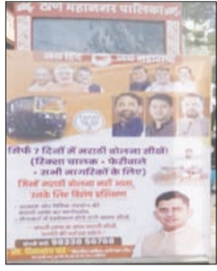
राज्यात शिक्षा आणि टॅक्सी चालकांसाठी मराठी भाषा अनिवार्य करण्याच्या निर्णयानंतर ठाण्यात एक वेगळाच उपक्रम सुरु झाला आहे. भाजपाच्यावतीने परंप्रांतीय शिक्षाचालक आणि फेरीवाल्यांसाठी मराठी शिकवण्याचे विशेष वर्ग आयोजित केले आहेत.

■ ठाणे राज्यात शिक्षा आणि टॅक्सी चालकांसाठी मराठी भाषा अनिवार्य करण्याच्या निर्णयानंतर ठाण्यात एक वेगळाच उपक्रम सुरु झाला आहे. भाजपाच्यावतीने परंप्रांतीय शिक्षाचालक आणि फेरीवाल्यांसाठी मराठी शिकवण्याचे विशेष वर्ग आयोजित केले आहेत. ज्या राज्यात आपण राहते, त्या राज्याची भाषा येणे आवश्यक आहे, मराठी न येणाऱ्या चालकांना नव्या नियमांमुळे अडचणी