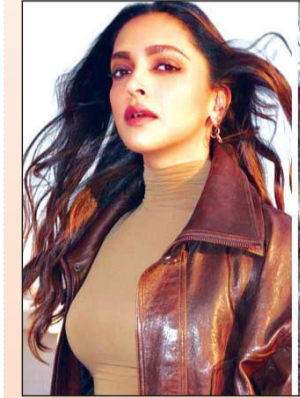
आल्याच्या अफवा पसरल्या होत्या. मात्र, चित्रपटाच्या टीमने या सर्व चर्चा फेटाळून

बातम्या पूर्णपणे बिनबुड्या आहेत. दीपिका आपल्या कामाचा वेग कमी करण्याच्या विचारात नाही. तिने नुकतीच एका ब्रँडची जाहिरात चित्रित केली असून, लवकरच ती 'राका' चित्रपटातील काही कठीण अंकांवर दृश्यांचे चित्रीकरण करणार आहे. सेटवर तिच्या मुखेची आणि प्रकृतीची पूर्ण काळजी घेऊन हे चित्रीकरण पार पडणार आहे. 'सिंगम अगेन' नंतर दीपिकाकडे अनेक मोठे चित्रपट आहेत. 'राका' व्यतिरिक्त ती सिद्धार्थ आनंद यांच्या 'किंग' या चित्रपटात शाहरुख खानसोबत दिसणार आहे. थोडक्यात दीपिका पदुकोणच्या वैयक्तिक आयुष्यातील आनंदाच्या बातम्यांचा तिच्या व्यावसायिक बांधिलकीवर कोणताही परिणाम झालेला नाही.