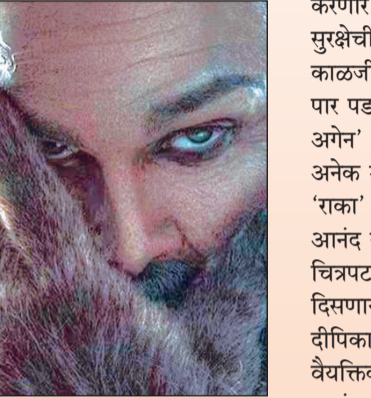
सर्व काही पूर्वनियोजित वेळापत्रकासारखे सुरू आहे. तिची भूमिका कमी केल्याच्या

टॉम क्रूझच्या चाहत्यांसाठी ही एक आनंदाची पर्वणी ठरणार आहे. 'टॉप गन' या जगप्रसिद्ध चित्रपटाला वर्षे पूर्ण झाल्यानंतर पॅरामाउंट पिक्चर्सने हा मूळ चित्रपट आणि त्याचा सिक्वेल पुन्हा एकदा मोठ्या पडद्यावर प्रदर्शित करण्याची घोषणा केली आहे. १५ मे २०२६ पासून भारतात केवळ एका आठवड्यासाठी हे दोन्ही चित्रपट चित्रपटगृहात अनुभवता येतील. १९८६ मध्ये आलेल्या मूळ 'टॉप गन' चित्रपटाने जागतिक सिनेमात एक वेगळा इतिहास रचला होता. टोनी स्कॉट दिग्दर्शित या चित्रपटात टॉम क्रूझने पीट मॅन्डरिक मिचेल ही धाडसी वैमानिकाची भूमिका साकारून