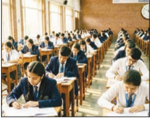
आता ती मुदत चार ते सहा वर्षांपर्यंत वाढवल्याचा आरोप कर्मचारी संघटनांनी केला.

मुंबई विद्यार्थी आणि पालकांमध्ये चिंतेचे वातावरण आहे. यापूर्वी दोन वर्षांनंतर बदलीची प्रक्रिया होती. मात्र हा निर्णय राज्य शिक्षण कर्मचारी संघटनेला विश्वासात न घेता एकतर्फी घेतल्याचा दावा करण्यात येत आहे. या निर्णयाविरोधात कर्मचाऱ्यांनी तीव्र नाराजी व्यक्त केली असून, २८ एप्रिलपासून कामबंद आंदोलन करण्याचा इशारा दिला. आंदोलन सुरु झाले, तर दहावी आणि बारावीच्या तपासणी, गुण नोंदणी, निकाल अंतिम करणे आणि निकाल जाहीर करण्याची प्रक्रियेवर परिणाम होऊ शकतो. महाराष्ट्र राज्य माध्यमिक आणि उच्च माध्यमिक शिक्षण मंडळातील कर्मचाऱ्यांच्या बदली आणि नियमांमध्ये बदल करण्यात आला आहे. याला विरोध करत मंडळाच्या कर्मचाऱ्यांनी २८ एप्रिलपासून कामबंद आंदोलनाचा इशारा दिला आहे. त्यामुळे राज्यातील दहावी आणि बारावीच्या परीक्षांचे निकाल लांबणीवर पडण्याची शक्यता निर्माण झाली आहे. यामुळे लाखो