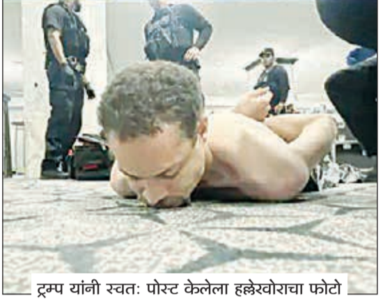
ट्रम्प यांनी स्वतः पोस्ट केलेला हल्लेखोराचा फोटो

या हल्ल्यापूर्वी कार्यक्रमाची माहिती देताना प्रेस सचिव कोरोलिना लेविट म्हणाल्या की, आज दिनारवेली ट्रम्प खास भाषण करणार आहेत, ते मजेशीर बोलतील. थोडा गोळीबारही करतील. हा व्हिडिओ व्हायरल झाला आहे. इराणने या वक्तव्याला महत्त्व देत हा हल्ला खरा होता की सहानुभूती मिळवायला ट्रम्प यांनी हे नाटक घडवून आणले असा सवाल केला. एक सामान्य तरुण एकट्याने दोन गन, चाकू, काडतुसे घेऊन येतो, ट्रम्प यांची सात स्तरांची सुरक्षा तोडतो आणि इतक्या जवळ येऊन गोळीबार करू शकतो यावर अनेकांचा विश्वास बसत नसल्याने हे रचलेले नाटक आहे अशीही चर्चा आहे.