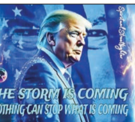
■ पान २ वर

मध्यपूर्वेतील वाढत्या युद्धजन्य परिस्थितीमुळे कच्च्या तेलाच्या किंमतीत मोठी वाढ झाली आहे. कच्च्या तेलाची किंमत १२६.३१ डॉलर प्रति बॅरलपर्यंत पोहोचली असून मार्च २०२२ नंतरचा हा सर्वोच्च स्तर आहे. सध्या कच्चे तेल सुमारे १२३ डॉलर प्रति बॅरल दराने व्यवहारात आहे. बारकाईने पाहिले जाते. विशेषतः इराणसोबत युद्धविराम करार न झाल्याच्या बातम्यांमुळे या पोस्टचा संबंध वाढत्या तणावाशी जोडला जात आहे. मात्र, या