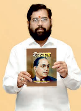
एकनाथ शिंदे उप मुख्यमंत्री, महाराष्ट्र राज्य