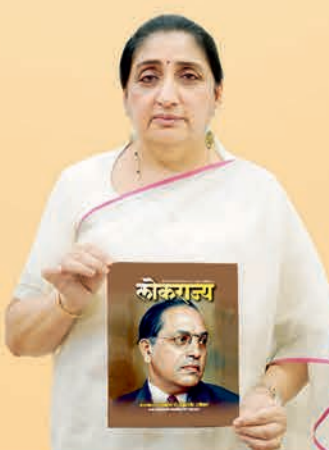
सुनेत्रा अजित पवार उप मुख्यमंत्री, महाराष्ट्र राज्य