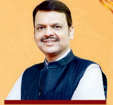
देवेन्द्र फडणवीस मुख्यमंत्री

महाराष्ट्र शासन ग्रामविकास व पंचायत राज विभाग उमेद - महाराष्ट्र राज्य ग्रामीण जीवनोन्नती अभियान