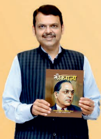
देवेन्द्र फडणवीस मुख्यमंत्री, महाराष्ट्र राज्य