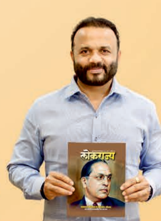
जयकुमार गोरे मंत्री, ग्रामविकास व पंचायत राज