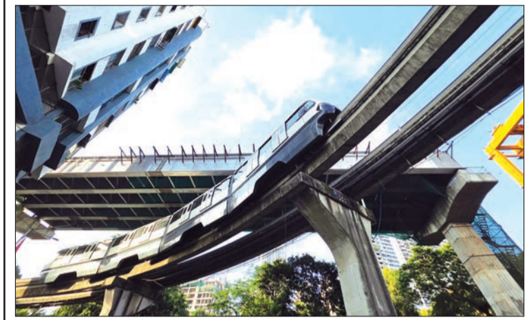
शिवडी ते वरळी अटल सेतू जोड मार्गाचे काम सुरू आहे, परळ गाव येथे या मार्गाच्या भल्या मोठ्या गडर टाकण्याचे काम झाल्यानंतर मोनोरेलची सध्या ट्रायल रन सुरू आहे.