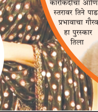
प्रियांकाला ‘ग्लोबल वॅगार्ड’

हिंदी चित्रपटसृष्टीचे महानायक अमिताभ बच्चन आगामी ‘कल्की २८९८ एडी’ या सायन्स फिक्शन चित्रपटामध्ये अश्वत्थामाच्या महत्त्वपूर्ण भूमिकेत दिसणार आहेत. या चित्रपटात त्यांच्यासोबत प्रभास, दीपिका पदुकोण आणि कमल हासन यांच्या प्रमुख भूमिका आहेत. याव्यतिरिक्त, ते ‘कलम २८’ आणि दक्षिणात्य सुपरस्टार रजनीकांत यांच्यासोबत ‘वेतैनयन’ या चित्रपटातही झळकणार आहेत. अलीकडेच त्यांनी सोशल मीडियाच्या माध्यमातून आपल्या मनातील घालमेल आणि अस्वस्थतेवर प्रकाश टाकला आहे. वयाची ऐंशी पार केल्यानंतरही