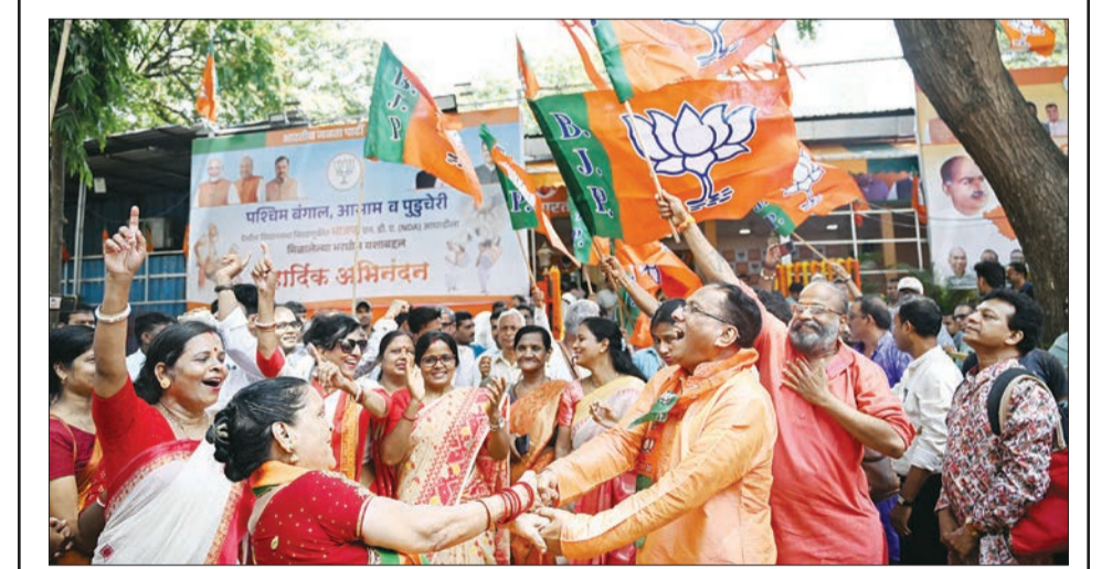
पश्चिम बंगाल, आसाम, आणि पुद्दुचेरी विधानसभा निवडणुकांमध्ये घवघवीत यश मिळाल्यामुळे मुंबईतील भाजपा कार्यवायाबाबेर भाजपा कार्यकर्त्यांनी ढोल-ताशाच्या गजरात जल्लोष केला.

शेतकरी पाण्यापासून वंचित राहत असल्याचा आरोप शेतकरी वर्गातून होत आहे. उसासारख्या पाण्यावर अवलंबून असलेल्या पिकांना निर्णायक टप्प्यावर पाणी न मिळाल्यास संपूर्णपणे हंगाम वाया जाण्याची भीती व्यक्त होत आहे.