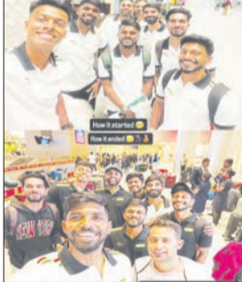
खेळाडूंना पाठिंबा दिला. अनेकांनी असे मत व्यक्त केले की, देशासाठी पदके जिंकून

म्हटले की, आम्ही घरी परतलो, पण गेल्या दोन आठवड्यांत काय घडले याची कोणालाच माहिती नाही आणि कुणालाही त्याची पर्वा नाही. त्यांनी कोणाचे नाव घेतले नसले तरी, त्यांच्या या वक्तव्यातून संघाच्या कामगिरीकडे दुर्लक्ष झाल्याची भावना स्पष्ट होते. चिरागनेही हाच संदेश शेअर केल्याने दोघांची नाराजी अधिक ठळक झाली. या संदेशानंतर चाहत्यांनीही प्रतिक्रिया देत