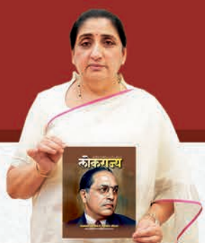
देवेंद्र फडणवीस मुख्यमंत्री