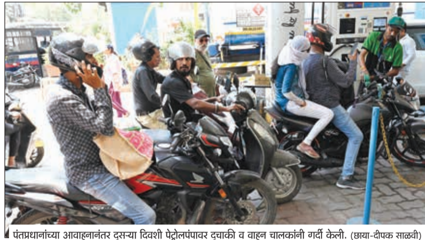
पंतप्रधानांच्या आवाहानंतर दुसऱ्या दिवशी पेट्रोलपंपावर दुचाकी व वाहन चालकांनी गर्दी केली.