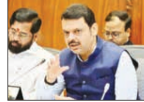
महाराष्ट्राला डॉलर इकॉनॉमी बनवण्याच्या दिशेने सरकार वेगाने पावले उचलत असून, त्याचा मोठा

हीतील व सर्वसामान्यांच्या खाशावरील भारही कमी होईल, असा विश्वास मुख्यमंत्री देवेंद्र फडणवीस यांनी व्यक्त केला. फायदा सर्वसामान्यांना मिळणार असल्याची ग्वाही मुख्यमंत्री देवेंद्र फडणवीस यांनी दिली आहे. आज सीआयआयच्या वार्षिक बैठक झाली त्यावेळी फडणवीस हजर होते. इंधन बचतीच्या मुद्यावरून पंतप्रधान मोदींवर टीका करणाऱ्या राहुल गांधींचा 'रिजेक्टेट मात' असा उल्लेख केला. ते म्हणाले की भविष्यात काय चित्र असेल या संकल्पनेवर आधारित असलेल्या सीआयआय बिझनेस समिटमध्ये मी महाराष्ट्राच्या प्रगतीचा अहवाल सादर केला.