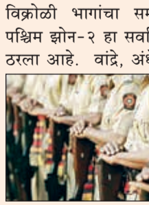
विजोळी भागांचा समावेश आहे. पश्चिम झोन-२ हा सर्वात मोठा झोन ठरला आहे. वांद्रे, अंधेरी, गोरगाव, मालाड आणि दहिसर यांसारख्या ठाण्यांचा त्यात समावेश आहे. उत्तर विभागातही नव्या झोन-१ ची निर्मिती करण्यात आली आणि उर्वरित झोनचे नामकरण केले आहे.

दक्षिण विभागात आता तीन झोन असतील. नव्या दक्षिण झोन-३ मध्ये मुंबई कोस्टल-१, मुंबई कोस्टल-२, वडाळा आणि शिवडी पोलीस ठाण्यांचा समावेश करण्यात आला आहे. मध्य विभागातही ताडदेव, भायखळा, दादर, माहीम आणि धारावी यांसारख्या ठाण्यांचे पुनर्गठन करून तीन झोन तयार केले आहेत. उत्तर पूर्व विभागात नवीन झोन-२ तयार केले आहेत. त्यात नेहरूनगर, घाटकोपर, टिळकनगर आणि