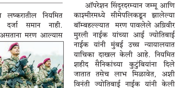
अग्निवीरांना सैनिकांप्रमाणे पेन्शन लाभांवर दावा करता येणार नाही