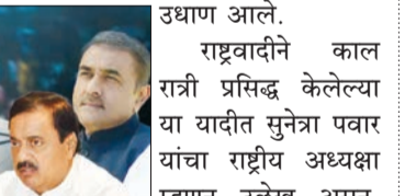
राष्ट्रवादी काँग्रेसच्या नव्या यादीवरून राज्यात खळबळ उडाली. निवडणूक आयोगाला सादर केलेल्या या यादीत पक्षातील ज्येष्ठ नेते प्रफुल्ल पटेल, सुनील तटकरे आणि छगन भुजबळ यांची नावे गायब झाल्याने चर्चेला उधाण आले आहे. यावर पक्षाध्यक्ष आणि उपमुख्यमंत्री सुनेत्रा पवार यांनी तांत्रिक चूक असल्याचे स्पष्टीकरण दिले.