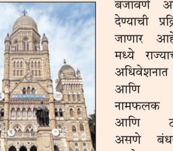
एक महिन्यात मराठी पाट्या लावा पालिकेकडून पुन्हा एकदा नवी मुदत

■ मुंबई मराठी पाट्यांच्या अंमलबजावणीबाबत मुंबई महानगरपालिकेने कठोर भूमिका घेतली आहे. शहरातील सर्व दुकाने, आस्थापने आणि कार्यालयांना मराठी भाषेत फलक लावण्यासाठी एक महिन्याची मुदत दिली आहे. या मुदतीनंतरही मराठी पाट्या न लावणाऱ्या दुकानांवर थेट बंदची कारवाई करण्यात येणार असल्याचा इशारा दिला आहे.