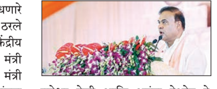
सरमा यांनी दुसऱ्यांदा आसामच्या मुख्यमंत्रिपदाची शपथ घेतली