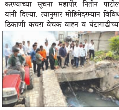
माध्यमातून परिसर स्वच्छता अभियान प्रभागीपणे राबविण्यात आले. यावेळी औषध फवारणी विभागाचे पर्यवेक्षक व कर्मचारी देखील उपस्थित होते.