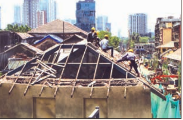
शिवडी-वरळी उन्नत मार्ग उभारणीसाठी प्रभादेवी येथील हाजी नूरानी चाळ पाडण्याच्या कामास सुरुवात झाली आहे.