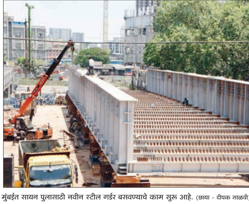
मुंबईत सायन पुलासाठी नवीन स्टील गर्डर बसवण्याचे काम सुरू आहे.