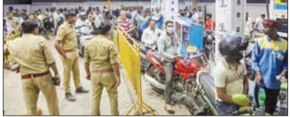
परिस्थिती अधिकच गंभीर बनली आहे. जिल्ह्यातील १६५ पैकी निम्म्याहून अधिक पेट्रोल पंप मागील तीन दिवसांपासून

न मिळाल्याने शेतकऱ्यांचे मोठे नुकसान होत आहे. मशागतीच्या हंगामात शेतीची कामे ठप्प झाली आहेत. हिंगोली जिल्ह्यातील ३५ पैकी २० पंपांवरील डिझेल संपल्याने परिस्थिती अधिकच बिकट झाली आहे. त्यामुळे संतस शेतकऱ्यांनी पेट्रोल पंपांवर ठिव्या आंदोलन करत केंद्र सरकारविरोधात घोषणाबाजी केली. एकूणच, इंधन टंचाईमुळे राज्यातील दैनंदिन जीवन विस्कळीत झाले आहे. परिस्थिती नियंत्रणात आणण्यासाठी प्रशासनाने तातडीने उपाययोजना कराव्यात, अशी मागणी