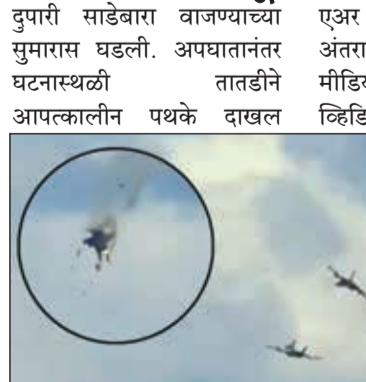
दुपारी साडेबारा वाजण्याच्या सुमारास घडली. अपघातानंतर घटनास्थळी तातडीने आपत्कालीन पथके दाखल झाली. अपघातस्थळाजवळ काळ्या धुराचे मोठे लोट दिसून आले. अपघातग्रस्त दोन्ही विमाने हवेल धडकल्यानंतर तुकडे होत खाली पडताना दिसतात. त्यानंतर चार पॅराशूट जमिनीकडे उतरताना दिसले.