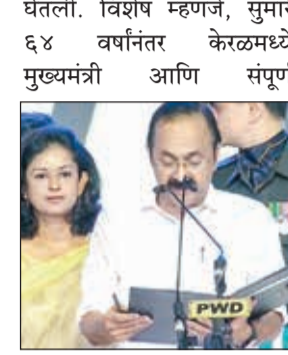
मंत्रिमंडळाचा एकाच वेळी शपथविधी पार पडला. यापूर्वी १९६२ साली तत्कालीन मुख्यमंत्री आर. शंकर

व्ही.डी.सतीशन केरळचे नवे मुख्यमंत्री ६४ वर्षानंतर मंत्रिमंडळाचाही शपथविधी करणार आहेत. विशेष म्हणजे, सुमारे ६४ वर्षानंतर केरळमध्ये मुख्यमंत्री आणि संपूर्ण मंत्रिमंडळाचा एकाच वेळी शपथविधी पार पडला. यापूर्वी १९६२ साली तत्कालीन मुख्यमंत्री आर. शंकर