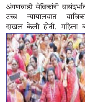
बालविकास विभागाने ४ जून २०२१ रोजी जारी केलेल्या सेवा प्रवेश नियमामधील नियम ७(१) (क) ला या याचिकेद्वारे आढावा

देण्यात आले होते. या नियमांमुळे पूर्ववैशिकापदासाठी पदोन्नतीची कमाल वयोमर्यादा ५५ वर्षांवरून थेट ४५ वर्षांवर आणण्यात आली होती. याचिकाकर्त्या सेविका गेल्या दोन दशकांहून अधिक काळ अंगणवाडी सेविका म्हणून कार्यरत आहेत. २००९ च्या शासन निर्णयानुसार दहा वर्षांची सेवा पूर्ण केलेल्या आणि आवश्यक शैक्षणिक पात्रता असलेल्या सेविकांना पूर्ववैशिकापदावर पदोन्नती देण्याची तरतूद करण्यात आली होती.