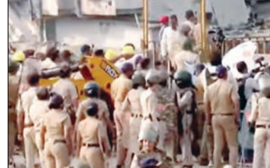
दगडफेक प्रकरणात अटक झालेले जण

मुंबई वांद्रे पूर्व येथील गरीब नगर झोपडपट्टी परिसरात रेल्वेच्या जागेवरील अतिक्रमण हटाव मोहीम आज सलग तिसऱ्या दिवशीही सुरु होती. उच्च न्यायालयाच्या आदेशानंतर सुरु झालेल्या या कारवाईत कालपर्यंत सुमारे ६० टक्के अतिक्रमण हटवण्यात आले असून, उर्वरित ४० टक्के भागावर आज बुलडोझर चालवण्यात आले. दरम्यान, काल झालेल्या दगडफेक प्रकरणी १६ जणांना अटक करण्यात आली आहे.