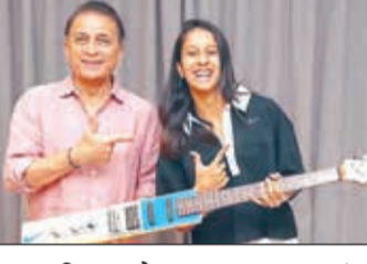
मिळवून दिला होता. त्या सामन्यांनंतर समालोचन करत असलेल्या गावस्कर यांनी गंमतीत जेमिमाला सांगितले होते की, भारताने विश्वचषक जिंकल्यास ते तिच्यासोबत गाणे गातील. यानंतर भारताने अंतिम सामन्यात

क्रिकेटपटू सुनील गावस्कर आणि जेमिमा रॉड्रिग्स यांची जोडी पुन्हा एकदा चर्चेत आली आहे. टी-२० विश्वचषक २०२६ पूर्वी दोघांचा एक नवीन इन्स्टाग्राम रील व्हायरल झाली. त्यामध्ये ते गिटार वाजवत गाणे गात आहेत. ही मैत्री २०२५ महिला वनडे विश्वचषकादरम्यान चर्चेत आली होती. ऑस्ट्रेलियाविरुद्धच्या उपांत्य फेरीत जेमिमाने नाबाद १२७ धावांची शानदार खेळी करत भारताला ऐतिहासिक विजय