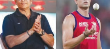
आहे. तू स्वतःवर विश्वास ठेवला, संयम राखला आणि शेवटपर्यंत सकारात्मक राहिलास. क्रिकेट हे केवळ कौशल्याचे नव्हे तर संयमाचेही खेळ आहे आणि आज तू दोन्ही गोष्टी उत्कृष्टपणे हाताळल्या. लखनौ संघ प्लेऑफच्या शर्यतीतून बाहेर पडल्यानंतर शेवटच्या साखळी