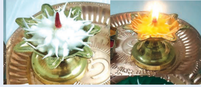
लावल्याने घरातील नकारात्मकता दूर होते, आर्थिक समृद्धी येते आणि लक्ष्मी-विष्णूची कृपा प्राप्त होते.

अधिक महिन्यात (पुरुषोत्तम मासात) कळव वार्तीचे दिवे लावणे अत्यंत शुभ आणि फलदायी मानले जाते. या संदर्भात खालील महत्त्वाची माहिती लक्षात ठेवा: महत्त्व: कळव वार्तीचे (कळवाच्या धाग्यापासून बनवलेली वात) दिवे हे भगवान विष्णू आणि लक्ष्मी माता यांना अत्यंत प्रिय आहेत. कालावधी: अधिक मासात (धोंडा महिन्यात) दररोज किंवा विशेषतः एकादशी, चतुर्दशी, पौर्णिमा या तिथींना संध्याकाळी तुळशीजवळ किंवा देवघरात हे दिवे लावावे. फळ: असे मानले जाते की, या वार्तीनी दिवा