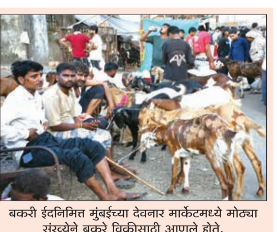
बकरी ईदनिमित्त मुंबईच्या देवनार मार्केटमध्ये मोठ्या संख्येने बकरे विक्रीसाठी आणले होते.

बजावणारी बेली केवळ श्रान नव्हती, तर पोलीस दलातील प्रत्येकासाठी ती कुटुंबातील सदस्यासारखी होती. पडद्या, शहापूर, मुरबाड परिसरात अनेक बंद घरांमध्ये झालेल्या घरफोड्यांचा तपास लावण्यात बेलीची मदत घेतली होती. महामार्गाच्या कडेला किंवा जंगलाने वेढलेल्या ग्रामीण भागात होणाऱ्या दरोड्यांच्या घटनांमध्ये आरोपी पळून जाण्यात यशस्वी व्हायचे.