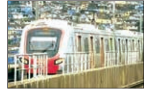
उल्हासनगरला जोडणाऱ्या मेट्रो मार्ग '५-अ' आणि तळोजा येथील मानपाडा, कल्याण फाटा आणि खुटीरगाव यांना जोडणाऱ्या मेट्रो मार्ग

वितरित केले जाईल आणि प्रत्येक टप्प्यासाठी किमान ५० कोटी रुपयांची रक्कम निश्चित केली जाईल. हा निधी दुर्गाडी-कल्याण आणि भोईरवाडी ते