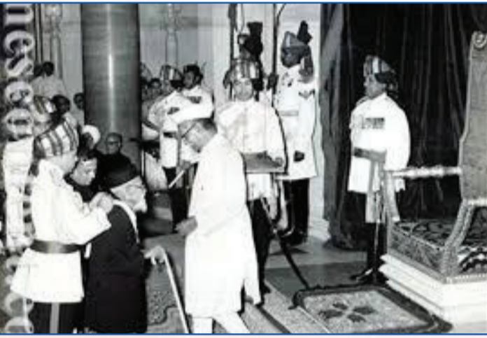
दुसरं तिसरं कुणीही नव्हतं तर साक्षात अण्णा होते. अण्णा म्हणजेच 'महर्षी धोंडो केशव' ! खरेखुरे क्रियाशील सुधारक! महर्षी कर्वे म्हणजे सेवामूर्ती. वयाची

'ती व्यक्ती कोण आहे,' हे तिथे हजर असलेल्या प्रत्येकाला माहीत असल्याने, तमाम पुणेकर जनतेने राष्ट्रपतींच्या या कृतीला पुन्हा एकदा प्रचंड टाळ्यांचा गजर करून मनमुराद दाद दिली. कारण, ती व्यक्ती म्हणजे