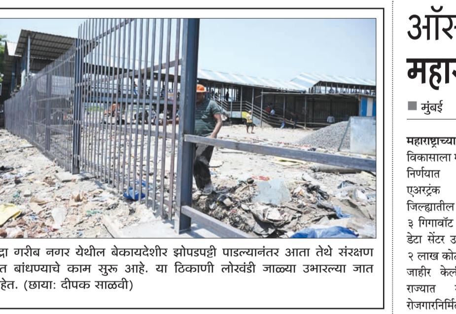
बांद्रा गरीब नगर येथील बेकायदेशीर झोपडपट्टी पाडल्यानंतर आता तेथे संरक्षण भिंत बांधण्याचे काम सुरू आहे. या टिकाणी लोरवंडी जाळ्या उभारल्या जात आहेत.

अचानक धूर निघू लागला व काही क्षणांतच आगने उग्र रूप धारण केले. बसमध्ये त्यावेळी एकूण ५४ प्रवासी प्रवास करत होते. अचानक आग लागल्याने प्रवाशांमध्ये घबराट पसरली. चालक व वाहक यांच्या ही बाब लक्षात आल्याने तत्काळ बस महामार्गाच्या कडेला थांबवून प्रवाशांना सुरक्षितपणे खाली उतरवले. प्रवाशांची सुटका सुरू असतानाच आगने संपूर्ण बसला वेदले. काही मिनिटांतच बस ज्वाळांच्या भक्ष्यस्थानी पडली.