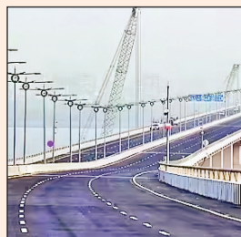
पायाभूत सुविधा उभारण्यासाठी आणि बसवण्यासाठी सहा महिन्यांच्या कालावधी देण्यात

आला असून, त्यानंतर १० वर्षे जाहिरातीचे प्रदर्शन व संचालन केले जाईल. यशस्वी बोलीदाराला तिमाही आधारवार प्रदर्शन शुल्क भरावे लागेल. करारावर स्वाक्षरी करण्यापूर्वी १० वर्षांच्या कालावधीतील शेवटच्या सहा महिन्यांच्या भाड्याइतकी सुरक्षा ठेव जमा करावी लागणार आहे. कंपनी कायदांतर्गत नोंदणीकृत कंपनी, भागीदारी संस्था आणि लिमिटेड लायबिलिटी पार्टनरशिप्स (एलएलपी) निविदेत सहभागी होऊ शकतात. मात्र संयुक्त उपक्रमांना म्हणजे जॉईंट व्हेंजरला परवानगी नाही. बोलीदारांची मागील तीन आर्थिक वर्षातील सरासरी वार्षिक उलाढाल किमान २० कोटी रुपये असणे आवश्यक आहे.