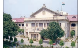
खूप कमी आहे. त्यामुळे एकेका न्यायाधीशाकडे एका दिवसाला ४००, ५००, ६०० आणि कधी कधी तर ८०० खटले सुनावणीस