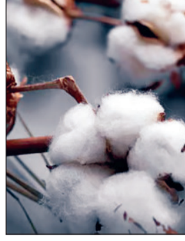
८,५०० रुपयांपर्यंत घसरला आहे. त्यामुळे कापूस साठवून ठेवलेल्या तसेच विक्रीच्या प्रतीक्षेत असलेल्या

मुंबई - केंद्र सरकारने कापसावरील ११ टक्के आयात शुल्क पुढील पाच महिन्यांसाठी रद्द करण्याचा निर्णय घेतल्यानंतर देशांतर्गत कापूस बाजारावर त्याचा मोठा परिणाम झाल्याचे दिसत आहे. या निर्णयानंतर कापसाच्या दरात १,००० रुपयांची घसरण झाली असून, त्यामुळे कापूस उत्पादक शेतकऱ्यांमध्ये नाराजी आहे. कापसाचा बाजारभाव सुमारे ९,५०० रुपयांवरून