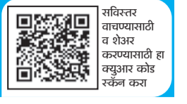
सविस्तर माहितीसाठी व शेअर करण्यासाठी हा क्विझ कोड स्कॅन करा