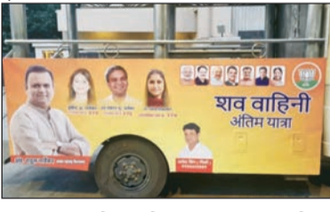
व्हायरल झाले आहेत. व्हायरल झालेल्या फोटोत विधानसभा अध्यक्ष राहुल नार्वेकर यांचा मोठा फोटो लावण्यात आला आहे.