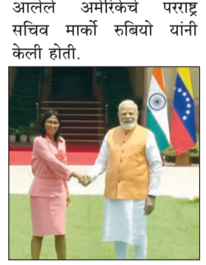
हैदराबाद हाऊस येथे झालेल्या या भेटीत भारत-व्हेनेझुएला संबंध अधिक

नवी दिल्ली पंतप्रधान नरेंद्र मोदी यांनी आज राजधानी दिल्लीत व्हेनेझुएलाच्या हंगामी राष्ट्राध्यक्ष डेल्सी एलोइना रॉड्रिग्येस यांची भेट घेत त्यांचे स्वागत केले. डेल्सी रॉड्रिग्येस या पाच दिवसांच्या भारत दौऱ्यावर आल्या असून त्यांच्या दौऱ्याला दोन्ही देशांच्या संबंधांच्या दृष्टीने महत्त्वाचे मानले जात आहे. विशेष म्हणजे, व्हेनेझुएलाच्या राष्ट्राध्यक्ष भारत दौऱ्यावर येणार आहेत, याची घोषणा काही दिवसांपूर्वी भारत भेटीवर