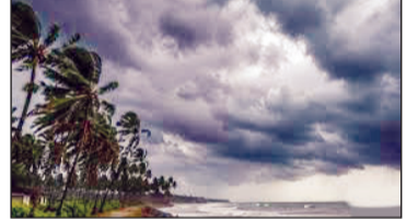
आगमनासाठी अनुकूल परिस्थिती आहे. राज्यात ६ जूनपासून कोल्हापूर, सांगली, सातारा, पुणे आणि सिंधुदुर्ग-रत्नागिरीच्या काही भागांत दगाळ वातावरणासह पावसाची

मुंबई त्याची आगोकूच होईल. पुढील दोन ते तीन दिवसांत गोवा, महाराष्ट्राचा काही भाग, सोबतच तामिळनाडू, कर्नाटक, बंगाल उपसागराचा काही भाग आणि ईशान्य भारतातील काही राज्यांमध्ये मान्सूनच्या भारतीय हवामान विभागाने (आयएमडी) आज मोसमी पाऊस केरळमध्ये दाखल झाल्याची घोषणा केली. नेहमीच्या वेळेपेक्षा ३ दिवस उशिराने आलेला मान्सून आता हळूहळू पुढे सरत असून ६ जूनला तो दक्षिण महाराष्ट्रात पोहोचेल, असा अंदाज आहे. हवामान खात्याने यापूर्वी मान्सून २६ मे रोजी केरळमध्ये पोहोचेल, असा अंदाज वर्तवला होता. भारतीय हवामान खात्याने दिलेल्या माहितीनुसार, मोसमी पावसाने केरळसह लक्षद्वीप, तामिळनाडू, कर्नाटक आणि अरबी समुद्रातील काही भाग व्यापले आहेत. वातावरणातील अनुकूल परिस्थितीमुळे पुढील काही दिवसांत