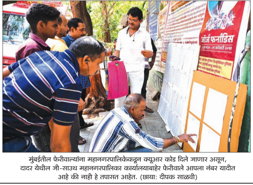
मुंबईतील फेरीवाल्यांना महानगरपालिकेकडून क्युआर कोड दिले जाणार असून, दादर येथील जी-साउथ महानगरपालिका कार्यालयाबाहेर फेरीवाले आपला नंबर यादीत आहे की नाही हे तपासत आहेत.

व्यापारी जहाजांवर केलेले हल्ले आणि होर्मुजच्या सामुद्रधुनीतून जाण्याच्या नियमांचे उल्लंघन केल्याचा आरोप करत इराणच्या लष्करी अधिकाऱ्यांनी हा हल्ल्याचे समर्थन केले. इराणने अमेरिकेच्या लष्करी जहाजावर केलेल्या हल्ल्यात किती नुकसान झाले आहे किंवा किती जणांचा मृत्यू झाला आहे, याबद्दल कोणतीही तपशीलवार माहिती उघड झालेली नाही. दरम्यान, इराणने कुवेतच्या आंतरराष्ट्रीय विमानतळाच्या परिसरावरदेखील हल्ला केला.