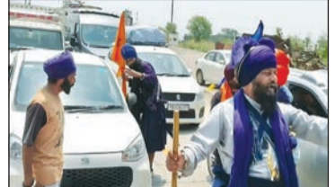
हिमाचलच्या वाहनांकडून वसुली सुरु

पंजाब-हिमाचल सीमेवर हिमाचल प्रदेश सरकारने लादलेल्या प्रवेश कर आणि टोलनाक्यांविरुद्ध सुरु असलेल्या आंदोलनाला आज एक नवीन वळण लागले. या संघर्षावर कोणताही तोडगा निघत नसल्यामुळे शिरोमणी जरील साहिबजादा बाबा जुझार सिंग निहंग सिंग खालसा दलाने किरतपूर-मनाली राष्ट्रीय महामार्गावरील गडाजवळ एक खालसा आणि प्रवेश कर वसुली सुरु केली.