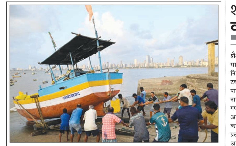
पावसाळ्यात दोन महिने मासेमारीवर बंदी असल्यामुळे वरळी कोळीवाड्यातील मच्छिमार बांधवांनी आपल्या बोटी समुद्रातून किनाऱ्यावर आणल्या

आणि कसबे सुकेने या रेल्वे स्थानकांच्या त्यामध्ये समावेश आहे. कुंभमेळ्यासाठी देश-विदेशातून लाखो भाविक नाशिक आणि त्र्यंबकेश्वरमध्ये राहण्यासाठी येणार आहेत. त्यांच्या सुविधेसाठी या रेल्वे स्थानकांवर अद्ययावत सोयी-सुविधा निर्माण केल्या जाणार आहेत. मध्य रेल्वे प्रशासनाच्या वतीने या स्थानकांवरील फ्लॉटांची संख्या वाढवणे, रेल्वे यार्डचे नूतनीकरण करणे, इलेक्ट्रॉनिक इंटरलॉक सिस्टिम अद्ययावत करणे, पादचारी पूल बांधणे अशी कामे केली जात आहेत. देवळाली रेल्वे स्थानकात अतिरिक्त उच्च स्तरीय फ्लॉटची निर्मिती, इंटरलॉकिंग सिस्टिम अद्ययावत करणे, पादचारी पूल आणि मलनिःसारण प्रकल्प आदी कामे सध्या प्रगतीपथावर आहेत. या स्थानकावर ५५५ मीटर लांबीचा नवीन फ्लॉट बांधण्याचे कामही सुरू आहे.