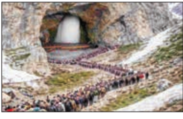
बेस कॅम्पवर पोहोचणाऱ्या यात्रेकरूसाठी श्रीनगर-जम्मू महामार्ग हा मुख्य रस्ता आहे. रस्ता सुशोभित करण्याव्यतिरिक्त प्रवास सुळीत आणि सुलभ व्हावा यासाठी विविध विभाग पायाभूत सुविधा सुधारणा, वाहतूक व्यवस्थापन आणि लाॅजिस्टिक्सच्या तयारीमध्ये गुंतले आहेत.

■ श्रीनगर ३ जुलैपासून सुरू होणाऱ्या अमरनाथ यात्रेच्या पार्श्वभूमीवर राष्ट्रीय महामार्ग प्राधिकरण आणि रामकी इन्फ्रास्ट्रक्चर यांनी श्रीनगर-जम्मू महामार्गावरील सुधारणा आणि सुशोभीकरणाच्या कामांना गती दिली आहे. यात्रेकरूंचा प्रवास अधिक सुलभ आणि सुरक्षित करणे, हा यामागील उद्देश आहे. अधिकाऱ्यांनी सांगितले की, महामार्गावरील अनेक ठिकाणी रंगकाम आणि देखभालीचे काम सुरू आहे. यामध्ये स्वच्छ आणि सुरक्षित वातावरण राखण्यासाठी रस्त्यावरील दुभाजक, क्रॅश बॅरियर्स, कर्बस्टोन्स आणि इतर पायाभूत सुविधांचा समावेश आहे. दरवर्षी देशभरातून हजारो यात्रेकरू या यात्रेत सहभागी होत असल्याने विविध संस्थांच्या तयारीचा हा एक भाग आहे. यात्रेचा ताफा येण्यापूर्वी निर्धारित वेळेत काम पूर्ण व्हावे, यासाठी महामार्गाच्या विविध भागांवर कामगार तैनात करण्यात आले आहेत. केवळ महामार्गाचे स्वरूप बदलणे हाच उद्देश नाही, तर यात्रेकरू आणि इतर प्रवाशांना सुरक्षित प्रवास सुनिश्चित करणे हा देखील आहे. अमरनाथ यात्रेदरम्यान बाल्टाल आणि नुनवान या दोन मुख्य