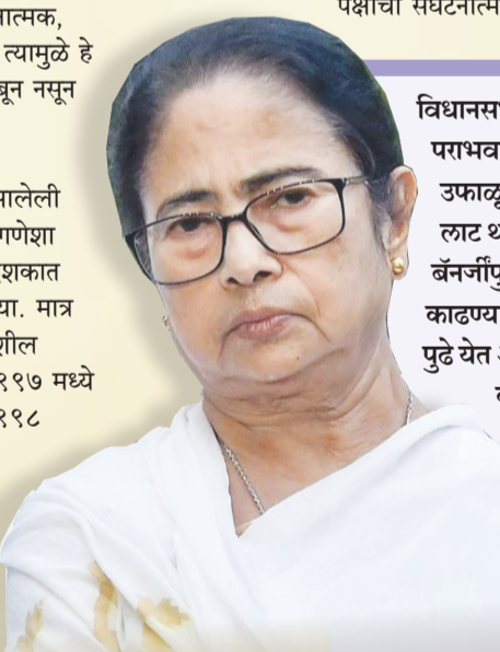
विधानसभा निवडणूक निकालांमधील

पश्चिम बंगालच्या राजकारणात सध्या अर्धवट घडामोडी घडत आहेत. एकेकाळी कॉंग्रेसविरोधातून जन्माला आलेल्या तृणमूल कॉंग्रेसच्या भवितव्याबाबत आता उलट चर्चा सुरु आहे. पक्षप्रमुख ममता बॅनर्जी आपल्या पक्षाचे कॉंग्रेसमध्ये विलिनीकरण करू शकतात, अशा चर्चेची राजकीय वातावरण तापले आहे. मात्र हा प्रश्न केवळ राजकीय नाही; तो घटनात्मक, कायदेशीर आणि संघटनात्मक गुंतागुंतीची वेढलेला आहे. त्यामुळे हे विलिनीकरण केवळ ममता बॅनर्जी यांच्या इच्छेवर अवलंबून नसून अनेक अटी आणि मर्यादांमधून मार्ग काढावा लागणार आहे.