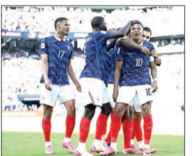
शिष्टी वाजेपर्यंत ही आघाडी कायम ठेवली. दुसऱ्या हाफमध्ये फ्रान्स अधिक आक्रमक दिसत होता. ४७ व्या मिनिटाला डेझायर डोएने फ्रान्ससाठी गोल करण्याचा प्रयत्न