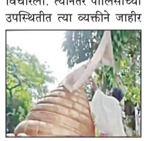
माफी मागून झेंडा हटवला. परंतु शिवरायांच्या जिरेटोपावर जैन धर्माचा झेंडा लावण्यामागील उद्देश काय होता? जैन

■ मुंबई मुंबईत ठिकठिकाणी पांढरे पट्टे ओढणाऱ्या जैन बांधवांनी आता हद्द गाठल्याने संताप उरळला आहे. मालाड पूर्व परिसरातील चौकात छत्रपती शिवाजी महाराजांच्या जिरेटोपावरच एका जैनाने पांढरा झेंडा लावला. याचा व्हिडिओ व्हायरल झाल्यानंतर वातावरण तापले. मनसे कार्यकर्त्यांनी तिकडे धाव घेऊन त्या जैनाला जाव