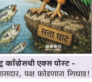
महाराष्ट्र काँग्रेसची एक्स पोस्ट - आमदार, खासदार, पक्ष फोडणारा गिधाड!

दिल्लीत कालपासून राजकीय नाट्य सुरू झाले. असे सांगण्यात येत आहे की फुटीर खासदारांनी आठ दिवसांपूर्वीच लोकसभेचे अध्यक्ष ओम बिर्ला यांना पत्र देऊन आपण स्वतंत्र गट स्थापन करत असल्याचे कळवले आहे. त्यांचा स्वतंत्र गट स्थापन करण्याची प्रक्रिया कधीच पूर्ण झाली आहे. उबाठाचे नेतृत्व बाळासाहेब ठाकरे यांच्या मूळ विचारांपासून भरकटले आहे. त्यांनी बाळासाहेबांच्या विचारांचा त्याग केला आहे. लवकरच उबाठा काँग्रेसमध्ये विलीन करण्याच्या हालचाली सुरू आहे. हे आढळल्याला मान्य नसल्याने आपण उबाठापासून वेगळे होण्याचा निर्णय घेतला आहे.