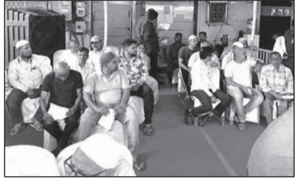
एका विशेष ग्राहक सेवा शिबिराचे आयोजन केले होते. या ग्राहक सेवा शिबिराला ग्राहकांकडून सकारात्मक

भिवंडी प्रतिसाद मिळाला व ५०० हून अधिक लोकांनी सहभाग घेतला. महावितरणकडील जुन्या प्रलंबित थकबाकीशी संबंधित मुख्य प्रश्न उपस्थित केले गेले. महावितरणच्या अधिकाऱ्यांनी ग्राहकांना अंशतः भरणा करण्याचे पर्याय उपलब्ध करून मदत केली. टॉरेंट पॉवरच्या अधिकाऱ्यांनी वीज बिल आणि वीज चोरीशी संबंधित समस्यांबाबत ग्राहकांना मार्गदर्शन व सहकार्य केले आणि डिजिटल पेमेंट सेवा, वीज सुरक्षा, ऊर्जा संवर्धन टिप्स, वीज चोरीबद्दल जागरूकता यासारख्या विषयांवर ग्राहकांमध्ये जागरूकता निर्माण केली.