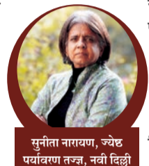
सुनीता नारायण, 'जेड पयावर'चा तज्ज्ञ, नवी दिल्ली

दिवसांत अधिक पाऊस पडत आहे. हा पाऊस अडवून ठेवण्यात आणि त्याद्वारे पृष्ठभागावरील तसेच भूजल साठ्यांचे पुनर्भरण करण्यात आपण अपयशी ठरलो, तर पाणीटंचाई आणि दुष्काळाची समस्या अधिक गंभीर होईल. भारतातील बहुतांश शेती ही अजूनही पावसावर आधारित आहे. सिंचनाखालील शेतीदेखील मोठ्या प्रमाणात भूजलावर अवलंबून आहे. देशातील ७० टक्क्यांहून अधिक पिण्याचे पाणी भूजल स्रोतांतून मिळते. म्हणूनच भारताचा खरा अर्थमंत्री म्हणजे भारतीय मान्सून, असे म्हटले जाते. त्याचा आपण पूर्ण आदर केला पाहिजे. पावसाचा प्रत्येक थेंब जिथे व जेव्हा पडतो, त्याचे महत्त्व ओळखले पाहिजे, त्याचा जपून उपयोग केला पाहिजे. हाच भारताच्या जलसुरक्षेचा, अन्नसुरक्षेचा आणि भविष्यातील शाश्वत विकासाचा सर्वात महत्त्वाचा पाया आहे. 'सीएसई'ने १९९० च्या दशकाच्या सुरुवातीला भारताच्या पारंपारिक जलसंधारण विज्ञानाचा अभ्यास करण्यास सुरुवात केली. आमचे एक पथक राजस्थानच्या वाळवंटातून