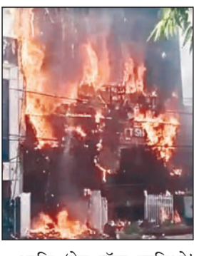
आणि 'हेड हॉपर स्टुडिओ' हे निवेशन व गॅमिंगसंबंधित कार्यालय आहे. दुपारी अचानक तिसऱ्या मजल्यावर आग लागली आणि काही क्षणांतच संपूर्ण इमारत धूर व आगीच्या ज्वाळांनी वेढली गेली. आग इतक्या वेगाने पसरली की विद्यार्थ्यांना आणि कर्मचाऱ्यांना बाहेर पडण्याची पान २ वर