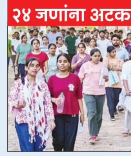
२४ जणांना अटक

गंभीर जखमी झाले. त्यांना रुग्णालयात दाखल केले. या घटनेची माहिती मिळताच मुख्यमंत्री योगी आदित्यनाथ यांनी अलीगडमधील नियोजित दौरा अर्धवट सोडून लखनौकडे रवाना झाले. त्यांनी घटनेची दखल घेत तानडीच्या चौकशीचे आदेश दिले आहेत. अलीगडमधील पुरानिया परिसरातील या इमारतीत तळमजला व पहिल्या मजल्यावर पाळीव प्राण्यांचे दुकान आणि क्लिनिक होते, तर दुसऱ्या मजल्यावर 'लॉनिंग स्पेस' नावाचे कोचिंग सेंटर