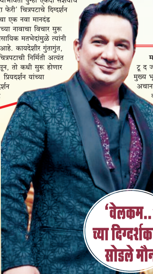
'वेलकम..' च्या दिग्दर्शकांनी सोडले मौन

'हेरा फेरी ३' च्या भवितव्याबाबत प्रश्नचिन्ह चित्रपटसृष्टीतील अत्यंत लोकप्रिय आणि क्लासिक समजल्या जाणाऱ्या 'हेरा फेरी' या चित्रपटाच्या तिसऱ्या भागाची प्रेक्षक बऱ्याच काळापासून उत्सुकतेने वाट पाहत आहेत. मात्र, या चित्रपटाच्या निर्मितीबाबतची अनिश्चितता आता अधिकच वाढली आहे. निर्माते फिरोज नाडियाडवाला यांनी अलीकडेच केलेल्या एका खुलाशानंतर, प्रसिद्ध दिग्दर्शक प्रियदर्शन यांनी आपण या चित्रपटाचा भाग नसल्याचे स्पष्ट केले आहे. प्रियदर्शन यांच्या या वक्तव्यामुळे 'हेरा फेरी ३' च्या भविष्याबाबतची पुन्हा एकदा संशयाचे ढग जमा झाले आहेत. प्रियदर्शन यांनी मूळ 'हेरा फेरी' चित्रपटाचे दिग्दर्शन केले होते, ज्याने बॉलिवूडमध्ये विनोदी चित्रपटांचा एक नवा मानदंड प्रस्थापित केला. त्यामुळे तिसऱ्या भागासाठीही त्यांच्या नावाचा विचार सुरू होता. मात्र, निर्मात्यांसोबतच्या वैयक्तिक आणि व्यावसायिक मतभेदांमुळे त्यांनी या प्रकल्पातून पूर्णपणे बाजूला होण्याचा निर्णय घेतला आहे. कायदेशीर गुंतागुंत, अंतर्गत वाद आणि वारंवार बदलणाऱ्या परिस्थितीमुळे या चित्रपटाची निर्मिती अत्यंत रंगळली आहे. चित्रपटाचे भवितव्य सध्या पूर्णपणे अधांती असून, तो कधी सुरू होणार किंवा कधी प्रेक्षकांच्या भेटीस येणार, याबाबत कोणतीही स्पष्टता नाही. प्रियदर्शन यांच्या जाण्याने आणि नाडियाडवाला यांच्या भूमिकेमुळे या चित्रपटाची कथा आणि दिग्दर्शन आता कोणत्या दिशेने जाणार, याबद्दल चित्रपट वर्तुळात उलटसुलट चर्चा सुरू झाल्या आहेत.