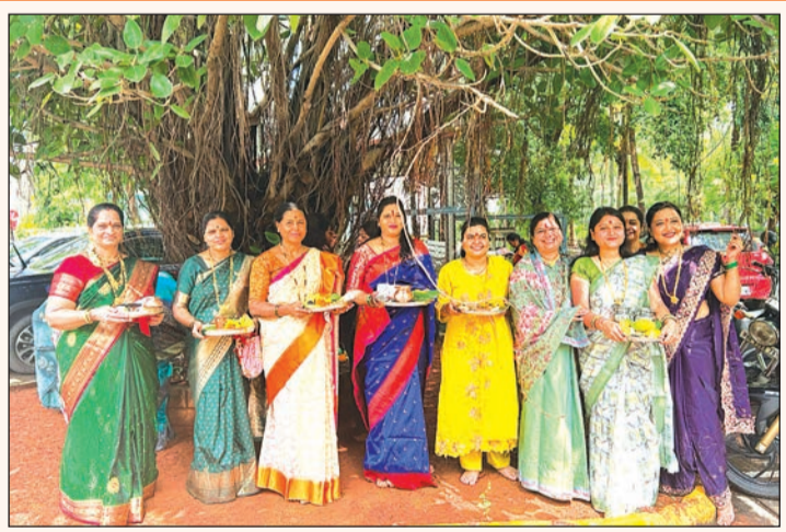
वटसावित्री पौर्णिमेनिमित्त नवी मुंबई सानपाडा येथील सेक्टर-९ मधील मिलियन टॉवर को-ऑपरेटिव्ह हौसिंग सोसायटीच्या महिलांनी वैवाहिक जीवनाच्या सुखासाठी आपल्याच परिसरातील वडाची पूजा केली.