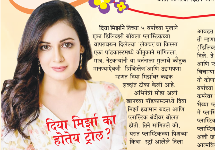
दिया मिर्झा का होतेय ट्रोल?

एसयूहीकारच्या मोहिमेचा मुख्य चेहरा म्हणून प्रेक्षकांच्या भेटीस येणार आहे. करीनाची स्टायल, आत्मविश्वास आणि स्वतंत्र ओळख ही 'मिनी' ब्रँडच्या फीचर्सशी मिळतीजुळती असल्याने ही युती करण्यात आली आहे. या मोहिमेच्या प्रसिद्ध झालेल्या पहिल्या फोटोमध्ये करीना 'मिनी कॅट्रिमन सी' या हिरव्या रंगाच्या आलिशान कार्सोबत एका आकर्षक अंदाजात दिसत आहे. प्रसिद्ध लक्झरी ऑटोमोबाईल ब्रँड 'मिनी इंडिया'ने आपली नवीन मोहीम सुरू केली असून, यासाठी बॉलिवूडची आघाडीची अभिनेत्री करीना कपूर खान हिची निवड केली आहे. करीना आता 'मिनी' परिवारात सामील झाली असून ती 'मिनी इनर सर्कल'चा एक महत्त्वाचा भाग बनली आहे. या नव्या भागीदारीअंतर्गत ती कंपनीच्या आगामी मिनी कॅट्रिमन सी या प्रीमियम