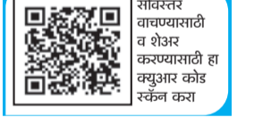
सविस्तर वाचण्यासाठी व शेअर करण्यासाठी हा क्वीआर कोड स्कॅन करा