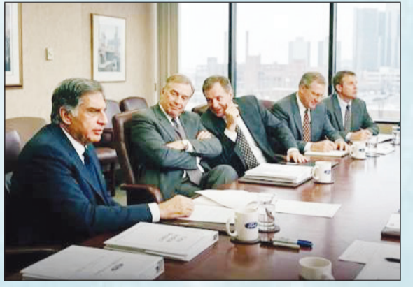
बिल फोर्डच्या ओठांतून ते वाक्य बाहेर पडलं आणि त्या क्षणी जणू अख्ख्या खोलीतली हवाच गोठली. तुम्हाला पॅरिंजर कार व्यवसायातून काहीच कळत नाही. हा करार न करून मी तुमच्यावर मोठे उपकार करतोय.

गर्वित उद्योगपती श्वास घेत होता - नऊ वर्षांपूर्वीच्याच माणसासमोर, पण आज पूर्णपणे वेगळ्या भूमिकेत, पूर्णापणे वेगळ्या नजरेने. दोन पूर्णांक तीन अब्ज डॉलर्सचा करार झाला. जवळ आणि लँड रोव्हर - ब्रिटिश साम्राज्याच्या अभिमानाची दोन प्रतीक, ज्यांच्या चाकांखालून एकेकाळी वसाहतवादाचा माज इंग्लंडच्या रस्त्यांवर फिरायचा, ज्या खिळखिळ्या इंग्लंडने दीडशे वर्षे भारतमातेला गुलामीत ठेवलं होतं - आज एका भारतीय समूहाच्या मालकीची झाली होती. इतिहासाने जणू स्वतःच एक वृद्ध पूर्ण केले, स्वतःचा पूर्ण एक ऋण, न मागताच, फेडलं गेलं. आणि मग तो क्षण आला, ज्यासाठी अख्खा भारत, नकळतच, नऊ वर्षे वाट बघत होता. बिल फोर्ड, तोच माणूस जो एकेकाळी उपकाराची भाषा बोलला होता, आज स्वतः रतन टाटांसमोर, त्याच बॉम्बे हाऊसमध्ये उभा राहून म्हणाला - तुम्ही जवळ-लँड रोव्हर विकत घेऊन आमच्यावर खूप