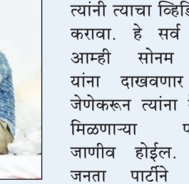
वांगचुक यांच्या समर्थनार्थ एक दिवसाचे उपोषण करत आहे. त्यांची प्रकृती

दिवसेंदिवस खालावत आहे. अशावेळी आपल्या सर्वांच्या पाठिंब्याची त्यांना गरज आहे. जे नागरिक उपोषणात सहभागी होतील त्यांनी त्यांचा व्हिडिओ पोस्ट करावा. हे सर्व व्हिडिओ आम्ही सोनम वांगचुक यांना दाखवणार आहोत, जेणेकरून त्यांना देशभरातून मिळणाऱ्या पाठिंब्याची जाणीव होईल. काँकरोच जनता पार्टीने 'पक्स'वर वांगचुक यांचा फोटो पोस्ट करत त्यांच्या प्रकृतीबाबत चिंता व्यक्त केली आहे.