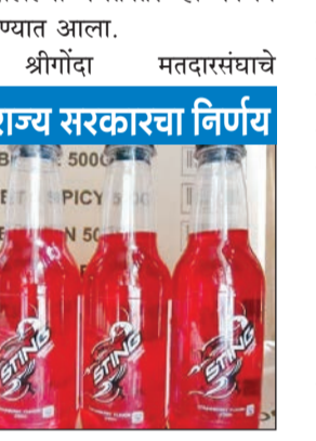
शाळांच्या ५०० मीटर परिसरात 'स्टिंग' एनर्जी ड्रिंक विक्रीस बंदी

मुंबई शाळांकरी विद्यार्थ्यांच्या आरोग्याच्या दृष्टीने राज्य सरकारने महत्त्वाचा निर्णय घेतला आहे. राज्यातील सर्व शाळांच्या ५०० मीटर परिसरात 'स्टिंग' एनर्जी ड्रिंकच्या विक्रीवर बंदी घालण्याचे निर्देश अन्न व औषध प्रशासनाला दिले आहेत. विधानसभेत या विषयावर झालेल्या चर्चेनंतर अन्न व औषध प्रशासन मंत्री नरहरी शिरवळ यांनी ही घोषणा केली. विद्यार्थ्यांमध्ये या पेयाचे वाढते आकर्षण आणि त्यातील कॅफिन व साखरेच्या प्रमाणाबाबत व्यक्त