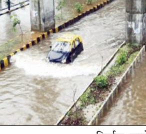
पालघर, ठाण्यात आज शाळांना सुटी

मुंबई निर्माण झालेल्या कमी दाबाच्या क्षेत्रामुळे पुढील दोन ते तीन दिवस महाराष्ट्रात सर्वत्र मुसळधार ते अतिमुसळधार पावसाची शक्यता हवामान विभागाने वर्तवली आहे. तर मुंबई, ठाणे, पालघरला उद्या पावसाचा रेड अलर्ट देण्यात आला आहे. ६