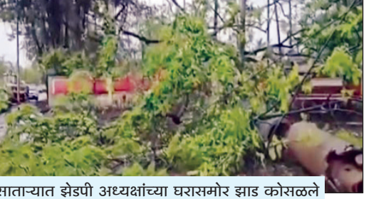
सातत्यात झेपीडी अध्यक्षीय घरासमोर झाड कोसळले

शाळांना सुट्टी जाहीर केली पालन करा. एनडीआरएफ, आहे. अत्यावश्यक काम एनडीआरएफ आणि आपत्ती असल्याशिवाय घराबाहेर पडू व्यवस्थापन यंत्रणा पूर्णपणे नका आणि प्रशासनाकडून सज्ज असून, परिस्थितीवर देण्यात येणाऱ्या सर्व अलर्टचे सातत्याने लक्ष ठेवून आहेत.