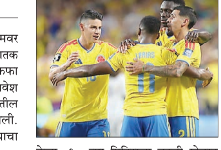
केला. १० व्या मिनिटाला बदली खेळाडू म्हणून आलेल्या लुईस सुआरेझने उभ्या असलेल्या आरियासला पास दिला, ज्याने वेळ न घालवता गोल केला. अँटोनियो सिमिओन्योने घानासाठी प्रयत्न केला. मात्र त्याचा जवळून मारलेला शॉट क्रॉसबारवरून