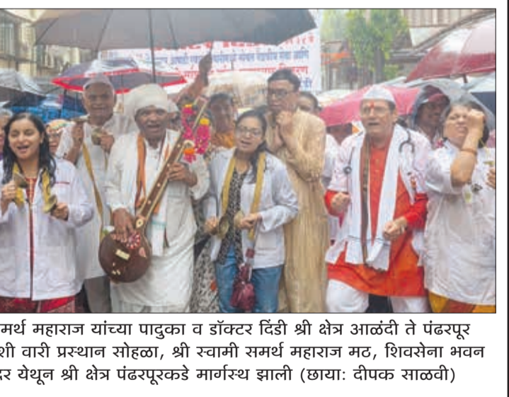
श्री स्वामी समर्थ महाराज यांच्या पादुका व डॉक्टर दिंडी श्री क्षेत्र आळंदी ते पंढरपूर आषाढी एकादशी वारी प्रस्थान सोहळा, श्री स्वामी समर्थ महाराज मठ, शिवसेना भवन शेजारी दादर येथून श्री क्षेत्र पंढरपूरकडे मार्गस्थ झाली