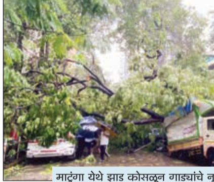
मार्दुंगा येथे झाड कोसळून गाड्यांचे नुकसान

राज्यात सुरू असलेल्या मुसळधार पावसामुळे मुंबईसह रायगड, कोकण आणि पश्चिम महाराष्ट्रातील अनेक जिल्ह्यात जनजीवन पूर्णपणे विस्कळीत झाले. अनेक ठिकाणी पाणी साचणे, झाडे व दरडी कोसळणे आणि पुरस्थिती निर्माण झाली असून मुंबई, ठाणे आणि पालघरला रेड अलर्ट जारी करण्यात आला आहे. रायगड जिल्ह्यात मुंबई गोवा महामार्गावर सुकेळी खिंडीतील असणाऱ्या जिंदाल कंपनीजवळ कंबरभर पाणी साचल्यामुळे दोन्ही दिशेकडील हजारो वाहन अडकून पडली. कुंडलिका आणि पाताळगंगा नद्यांनी धोक्याची