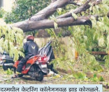
दादरमधील केटरिंग कॉलेजजवळ झाड कोसळले.