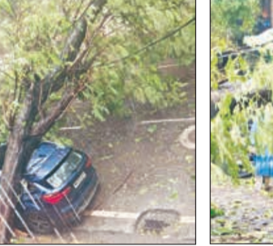
दादरमधील केटरिंग कॉलेजजवळ झाड कोसळले.