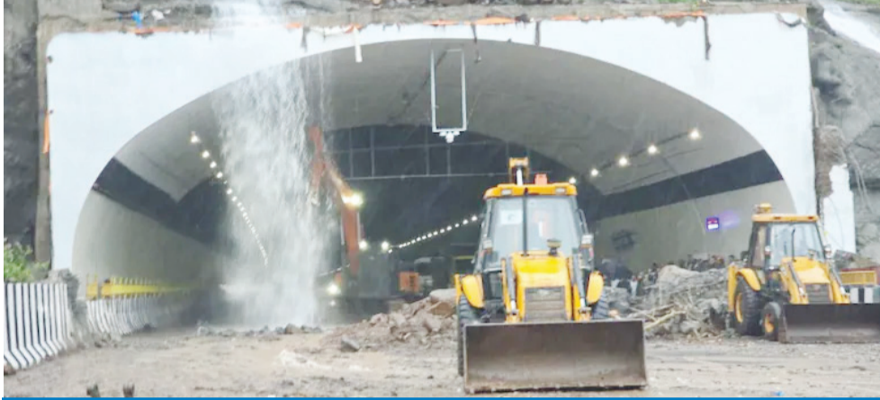
७,१२० कोटींच्या 'मिसिंग लिंक'ची संरक्षक भिंत २ महिन्यांतच कोसळली

राज्यात गेले काही दिवस सुरू असलेले जोरदार पावसाचे सत्र आजही कायम राहिले. या पावसामुळे आज नव्याने बांधलेल्या मिसिंग लिंक बोगद्याजवळ दरड कोसळल्याने पुणे-मुंबई जुना व नवा महामार्ग आणि कनेक्टिंग लिंक हे सर्वच वाहतुकीसाठी बंद होऊन दोन्ही शहरांतील संपर्क पूर्णपणे तुटला. उरण येथील जेएनपीए परिसरात वाहणाऱ्या जोरदार वादळी वाऱ्यामुळे जहाजातील कंटेनर हवेने उडून खाली पडल्याने एका कामगाराचा मृत्यू, तर दोघेजण गंभीर जखमी झाले. मुंबई, ठाणे, रायगड, रत्नागिरी, पुणे आणि नाशिकसह अनेक जिल्ह्यांमध्ये पूर, दरडी कोसळणे, झाडे पडणे आणि इमारतींच्या दुर्घटनांची मालिका सुरू राहिली. मुंबईत पावसाशी संबंधित विविध घटनांमध्ये आतापर्यंत १३ जणांचा मृत्यू झाला असून, अनेक जण जखमी झाले आहेत. राज्यभर उद्याही मुसळधार पाऊस सुरू राहणार असल्याचे हवामान विभागाने म्हटले असून, उद्या नाशिक जिल्ह्यातील त्र्यंबकेश्वर परिसरात ढगफुटीसदृश अतिवृष्टीचा इशारा दिला आहे. त्यानुसार प्रशासनाने हाय अलर्ट जारी करून शाळा, महाविद्यालये आणि त्र्यंबकेश्वर व ससशुंगी देवस्थाने बंद ठेवण्याचा निर्णय घेतला आहे.