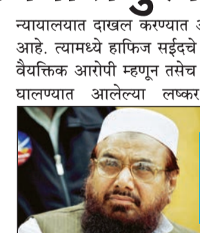
तैयबा आणि त्याची छुपी संघटना द रेझिस्टन्स फ्रंटचा संस्थापक व प्रमुख म्हणून नमूद करण्यात आले आहे. एनआयएच्या माहितीनुसार, भारतीय न्याय संहिता बीएनएस, २०२३ तसेच बेकायदेशीर कृत्ये

पहलगाम दहशतवादी हल्ला प्रकरणात आज एनआयएने (राष्ट्रीय तपास संस्था) विशेष न्यायालयात पुरवणी आरोपपत्र दाखल केले. पाकिस्तानी दहशतवादी संघटना लष्कर-ए-तैयबाचा प्रमुख हाफिज सईद हा या हल्ल्याचा सूत्रधार असल्याचा आरोप एनआयएने केला आहे. या हल्ल्यात २५ पर्यटक आणि एका स्थानिक नागरिकासह एकूण २६ जणांचा मृत्यू झाला होता.