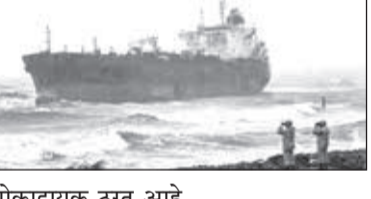
धोकादायक ठरत आहे. एका निवेदनात, तटरक्षक दलाने म्हटले आहे की, खराब हवामानामुळे एमटी अस्पॉल्ट स्टार, एमटी स्टेलर रुबी आणि एमटी अल जाफझिया ही

मुंबईत मुसळधार पाऊस, सोसाट्याचे वारे आणि खवळलेल्या समुद्रामुळे निकाराग्वा देशाचे 'एमटी अल जाफझिया' हे मालवाहू जहाज मुंबईतील मनोरी समुद्रकिनार्याजवळ खडकावर अडकले आहे. सुरदैवाने, हे जहाज मानवरहित आहे. सध्या भारतीय तटरक्षक दल आणि नौदल घटनास्थळी दाखल झाले असून परिस्थितीवर करडी नजर ठेवून आहेत. हे भरकटलेले मालवाहू जहाज मनोरी किनाऱ्यापासून साधारण १ किलोमीटर अंतरावर खडकावर अडकले आहे. गोरई पोलिसांनी तत्काळ माहिती दिल्यानंतर भारतीय तटरक्षक दल आणि नौदल घटनास्थळी दाखल झाले असून परिस्थितीवर करडी नजर ठेवून आहेत. एका निवेदनात, तटरक्षक दलाने म्हटले आहे की, खराब हवामानामुळे एमटी अस्पॉल्ट स्टार, एमटी स्टेलर रुबी आणि एमटी अल जाफझिया ही तटरक्षक, नौदल करडी नजर ठेवून परिस्थितीवर करडी नजर ठेवून आहे. जहाजे भरकटली असल्याबाबत ५ जुलै समुद्रात ताशी ८० ते ९० किमी वेगाने वारे होत. त्यामुळे परिस्थितीचा आढावा घेण्यासाठी आणि जहाजांना आवश्यक ती मदत पुरवण्यासाठी आयसीजीएस सम्राटला त्या भागात वळवण्यात आले. त्याचवेळी, मदत पुरवण्यासाठी ईटीव्ही वॉटर लिली नौनात करण्याची विनंती डीजी शिंपिंगला करण्यात आली. त्यानंतर एमटी अस्पॉल्ट स्टार आणि एमटी स्टेलर रुबी ही दोन जहाजे सुरक्षित ठिकाणी नांगरण्यात आले. मात्र एमटी अल जाफझिया हे जहाज अद्याप समुद्रातील खडकाळ भागात अडकून पडले आहे. हे जहाज निकाराग्वा देशाचे असून त्याची लांबी १८२.७५ मीटर आणि रुंदी ३२.२६ मीटर इतकी आहे.