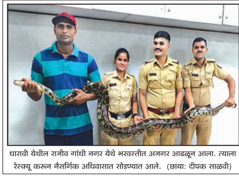
धारावी येथील राजीव गांधी नगर येथे भरवरीत अजगर आढळून आला. त्याला रेस्क्यू करून नैसर्गिक अधिवासात सोडण्यात आले.

मुसळधार पावसामुळे भिवंडीतील अनेक भागांमध्ये मोठ्या प्रमाणात पाणी साचले असून, त्याचा वीजपुरवठावर परिणाम झाला आहे. अनेक ठिकाणी वीज वितरण यंत्रणा पाण्याखाली गेल्याने आणि वीज खांब, वाहिऱ्यांचे नुकसान झाल्याने अनेक भाग अंधारात आहेत. या पार्श्वभूमीवर टॉरेंट पॉवरने नागरिकांच्या सुरक्षेला प्राधान्य देत अलर्ट जारी केला.