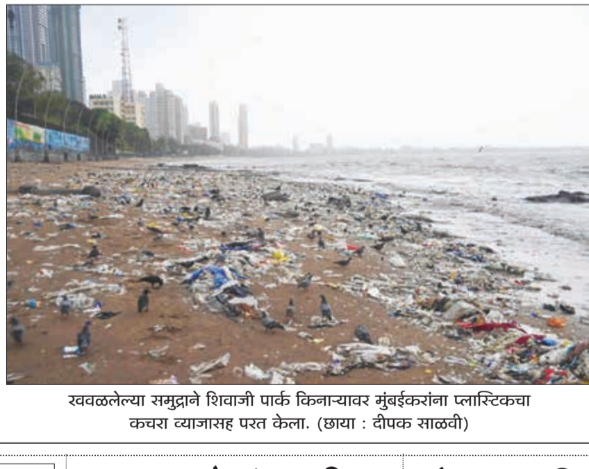
खवळलेल्या समुद्राने शिवाजी पार्क किनाऱ्यावर मुंबईकरांना प्लास्टिकचा कचरा व्याजासह परत केला.

शहापूर पाणलोट क्षेत्रात झालेल्या जोरदार पावसामुळे सापगावजवळील भातसा नदी धोकादायक पातळीवरून वाहत आहे. प्रशासनाने नदीवरील पुलांवर खबरदारी घेत आजूबाजूच्या गावांना सतर्क राहण्याच्या सूचना दिल्या आहेत. सुरक्षेच्या कारणास्तव चिंतामणी मेंडोस संकुल ते महिला मंडळ शाळा व ग.वि. खाडे विद्यालय मैदानाकडे जाणारा रस्ता तात्पुरता बंद करण्यात आला आहे. शालेय विद्यार्थी, पालक आणि नागरिकांनी पर्यायी मार्गांचा वापर करावा, असे आवाहन शहापूर नगरपंचायत प्रशासनाने केले आहे. शहापूर पंचायत समितीजवळील मराठा खानावळ परिसरात मोठ्या प्रमाणावर पाणी साचल्याने रविवाशांना मनस्ताप सहन करावा लागत आहे. तावडेनगर येथील अनेक घरांमध्ये पावसाचे पाणी घुसल्याने संसारेपयोगी साहित्याचे मोठे नुकसान झाले आहे.