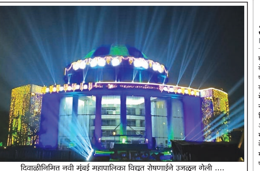
दिवाळीनिमित्त नवी मुंबई महापालिका विद्युत रोषणाईने उजळून गेली ....

मी राष्ट्राध्यक्ष झाले तर त्यांचे रक्षण करेन. कडुरपंथी डाव्यांच्या धर्मविरुधी अजेंड्यापासून हिंदूंचे संरक्षण करू असेही ट्रम्प म्हणाले. त्यांनी पंतप्रधान मोदींचे त्यांचे चांगले 'मित्र' म्हणून वर्णन केले आणि भारतासोबत चांगले संबंध प्रस्थापित करण्याचे सुतोवाच केले. ट्रम्प म्हणाले की, आम्ही अमेरिकेला पुन्हा मजबूत करू आणि येथे शांतता प्रस्थापित करू. बांगलादेश हिंसाचाराच्या मुद्द्यावर ट्रम्प यांनी वक्तव्य करण्याची ही पहिलीच वेळ आहे.