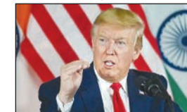
जागा मिळाल्या आहेत.

सिनेटच्या निवडणुकीत त्यांना ५२ जागा मिळाल्या आहेत. तर कमला हॅरिस यांना ४६ जागा मिळाल्या आहेत. या विजयानंतर परंपरेप्रमाणे ट्रम्प हे येल्या १३ नोव्हेंबर रोजी व्हाईट हाऊसमध्ये जाऊन राष्ट्राध्यक्ष यांचे बायडन यांची भेट घेणार आहेत. अमेरिकेत सत्ता हस्तांतरणाच्या प्रक्रियेच्या दृष्टीने ही भेट महत्त्वाची असे. २०२० साली डोनाल्ड ट्रम्प यांचा पराभव झाला होता, तेव्हा राष्ट्राध्यक्ष असलेल्या ट्रम्प यांनी मात्र ही परंपरा पाळली नव्हती.