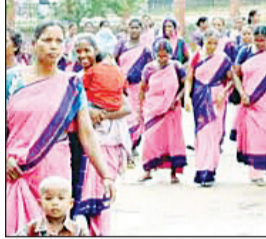
'आयफा' ची केंद्राकडे मागणी

नाशिक - अशी भूमिका मांडली की, १७ नोव्हेंबरला अनेक शिवसैनिक शिवतीर्थावर येत असतात. हिंदुधर्मप्रसारात बाळासाहेब ठाकरे यांच्या स्मृतिदिना निमित्त १७ नोव्हेंबरला उद्धव बाळासाहेब ठाकरे गटाचे सभेसाठी शिवतीर्थाची मागणी मुंबई महापालिकेसाठी केली आहे. शिंदे गटानेही याच दिवशी सभेसाठी हे मैदान मागितले आहे. महापालिकेने यावर अजून निर्णय घेतलेला नाही. आज ठाकरे गटाचे खासदार संजय राऊत यांनी