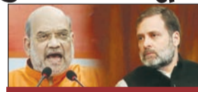
अमित शहा यांचा राहुल गांधींवर हल्लाबोल

विधानसभा निवडणुकीच्या प्रचारासाठी आज तुपारी केंद्रीय गृहमंत्री अमित शहा यांनी सिंदखेडमध्ये प्रचारसभा घेत राहुल गांधी यांच्यासह काँग्रेसवर जोरदार प्रहार केला. या सभेत अमित शहा म्हणाले की, काँग्रेसचे ३७० कलम पुन्हा आणणार असल्याचे राहुल गांधी म्हणत आहेत. मी आज सांगतो की, इंदिरा