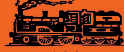
निशाणी - रेल्वे इंजिन