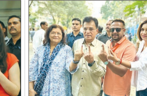
भाजपा नेते किरीट सोमय्या यांनीही आपल्या पत्नी व मुलांसह मतदान केले.