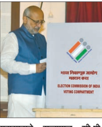
महाराष्ट्राचे राज्यपाल सी.पी. राधाकृष्णन मतदान करताना.