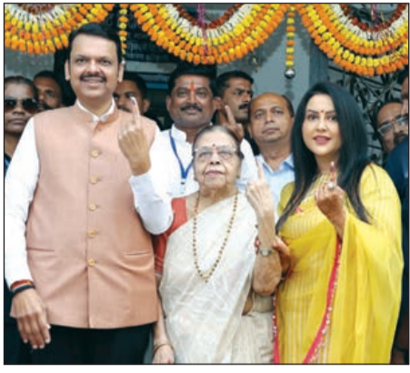
उपमुख्यमंत्री देवेंद्र फडणवीस यांनी पत्नी व आईसह मतदानाचा हक्क बजावला.