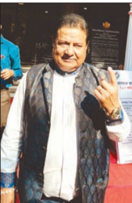
भजन सम्राट अनूप जलोटा यांनी मतदान केले.