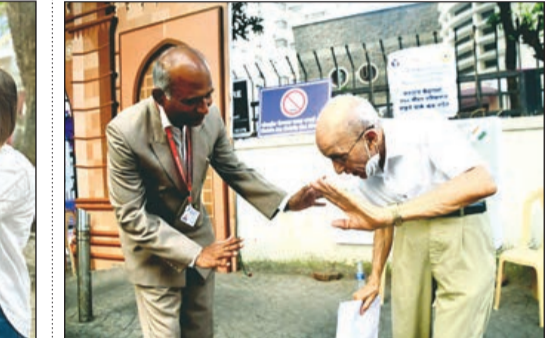
राज्य निवडणूक आयोगाचे प्रमुख चोकलिंगम मतदान केंद्रावर वृद्ध मतदाराला मदत करताना.