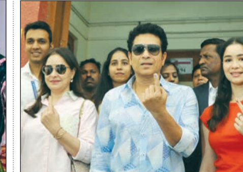
मास्टर ब्लास्टर सचिन तेंडुलकर यांनीही आपल्या कुटुंबासमवेत मतदानाचा हक्क बजावला.