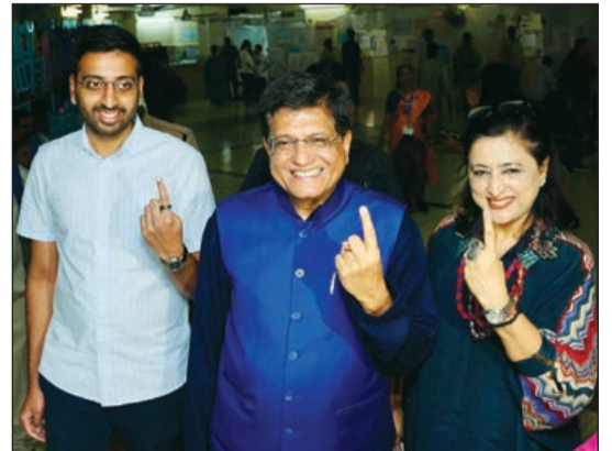
भाजपाचे खासदार पियुष गोयल यांनी सहपरिवार मतदान केले.