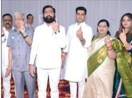
मुख्यमंत्री एकनाथ शिंदे यांनी सहपरिवार मतदानाचे कर्तव्य पार पाडले.