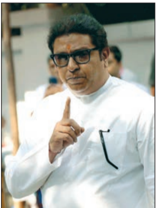
मनसे प्रमुख राज ठाकरे यांनीही मतदानाचा हक्क बजावला.