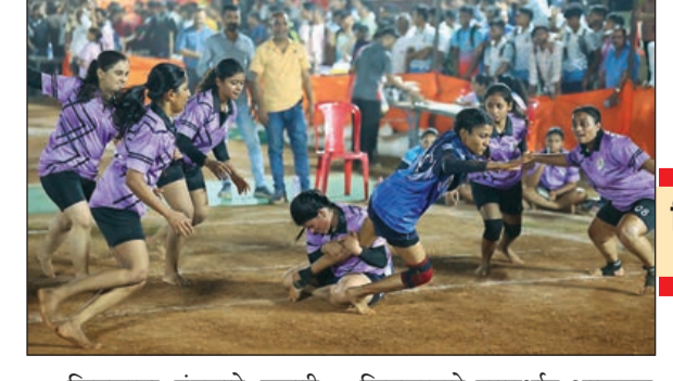
शिवकन्या मंडळाने कुमारी गटात चेंबूर क्रीडा केंद्राला नमवित या गटात उपांत्यपूर्व फेरी गाठली. पूर्वार्धात ०९-११ अशा पिछाडीवर पडलेल्या शिवकन्याने उत्तरार्धात आक्रमण आपल्या बाजूने झुकविला. महिला गटात वंदे मातरम्ने आकाश स्पोर्ट्सचा सहज